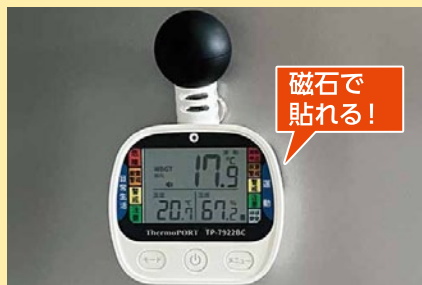
※ホワイトボードなど設置面により貼付・固定できないことがあります