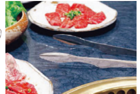
●テーブルに置いた時にトングの先がテーブルに触れず、衛生的です。