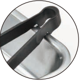
●お皿のフチにかけられる引掛付