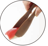
●食材がこびりつきにくいダブルエンボス加工付