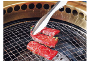
●つかみやすい形状で、焼肉などに最適です。