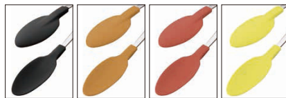
ブラック オレンジ レッド イエロー