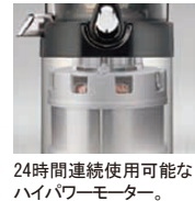
24時間連続使用可能なハイパワーモーター。