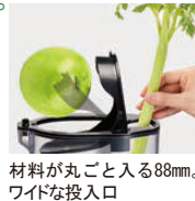
材料が丸ごと入る88mm、ワイドな投入口

製品構成:本体、ドラムセット、押し込み棒、回転洗浄ブラシ、洗浄ブラシ、排出口洗浄ブラシ、繊維質カップ、ジュースカップ、レシピブック、取扱説明書、保証書