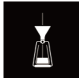
プアオーバー(透過法)