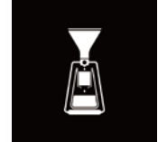
コールドドリップ(水出し)