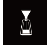
イマージョン(浸漬法)