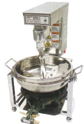
KRミニ (ガスコンロはオプションです)