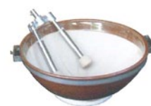
2本杓 / すり鉢セット