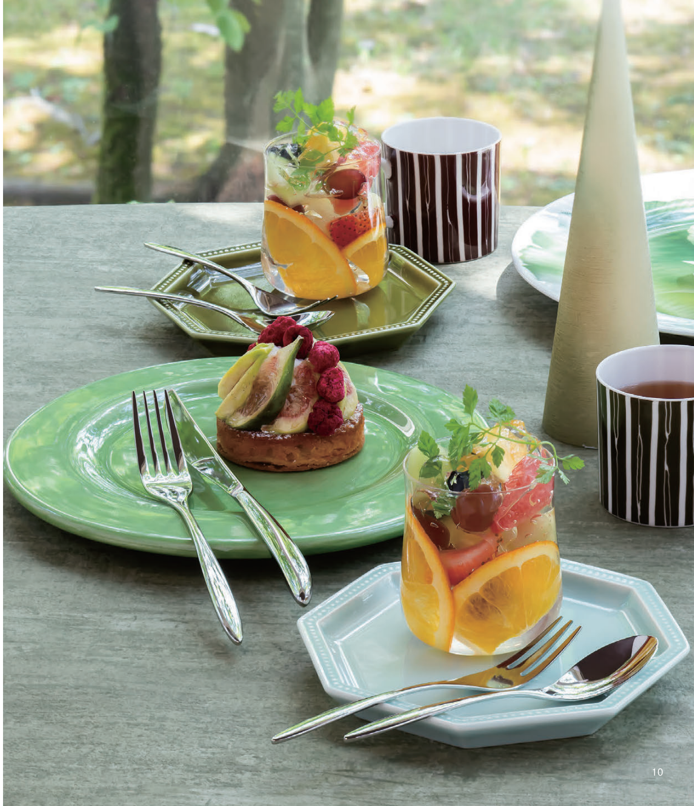
コーヒースプーン OBI0209 111×20mm ¥ 460