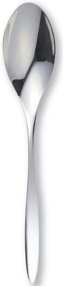
テーブルスプーン OBI0203 221×42mm ¥ 640