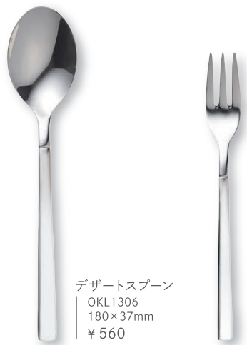
デザートスプーン OKL1306 180×37mm ¥ 560