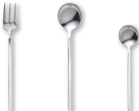
ティーケーキフォーク OBS0107 141×17mm ¥860