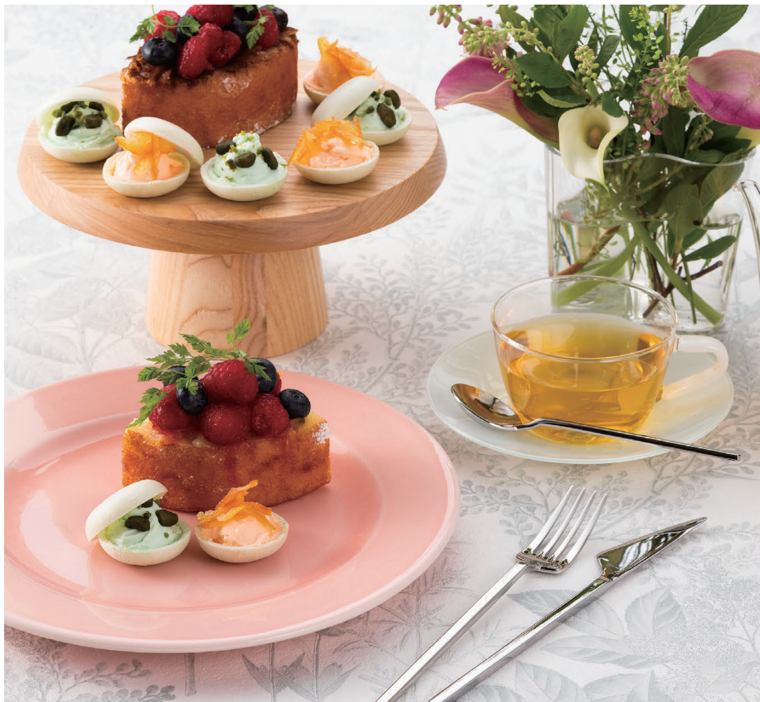
コーヒースプーン OBS0109 111×26mm ¥580