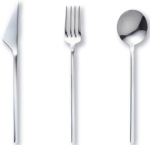
デザートナイフ(刃付) OBS0104 190×(刃渡り)58mm ¥1,060

スマートなラインが魅せる直線的なフォルム。 大胆さと可憐さを兼ね備えデザートタイムを盛り上げます。