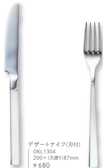
デザートナイフ(刃付) OKL1304 200×(刃渡り)87mm ¥ 680

飾り気のない上品さでスイーツを真の主役へと引き立たせる。 柄のラインがアクセントとなり空間に落ち着きを与えます。