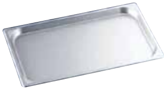
マイスター アルミ ホテルパン (硫酸アルマイト加工・膜厚6ミクロン) (AHT-87)

焼物などに最適なフッ素樹脂加工。こびりつきを 방지、油污れも簡単に洗浄できます。