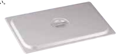
マイスター アルミホテルパンカバー (硫酸アルマイト加工・膜厚6ミクロン) (AHT-98)