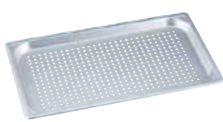
マイスター アルミ 穴明ホテルパン (硫酸アルマイト加工・膜厚6ミクロン) (AHT-88)