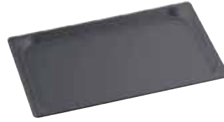
マイスター アルミ ノンスティック ホテルパン (AHT-91)