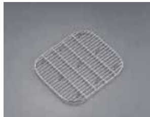
DO-EN 18-8 ガストロノームパン用網 2/3用