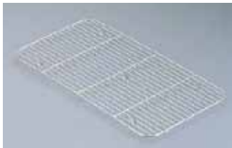
Ω 18-8ホテルパン用網 (AHT-37)