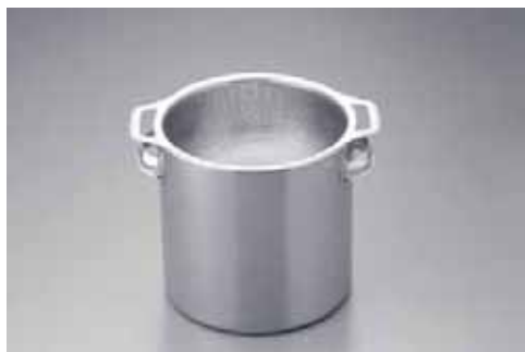
業務用総合カタログV16 P199① UK18-8目盛付キッチンポットとの組み合わせ例です。