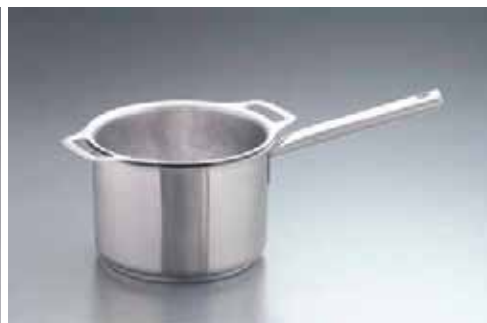
業務用総合カタログV16 P6① ムラノインダクション片手深型鍋との組み合わせ例です。

ハンバーグやステーキ、餃子にアヒージョetc... 器としてテーブルにサーブすれば素材の旨みも逃しません!