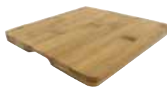
鉄鑄物 スキレット用木台 〈ASK-68〉