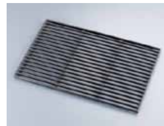
TKG 鉄鑄物 ロストル (焼きアミ) 〈GLS-07〉