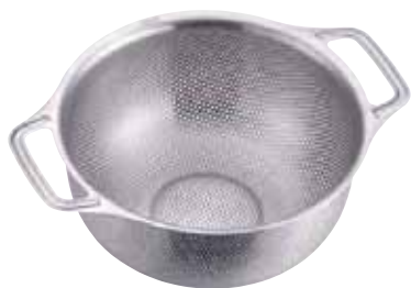
ドンナム 18-8パンチングザル