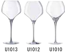
タニック 55 U1013 (6ヶ入)

ダイナミックな形状により、ワインが空気に十分に触れてすばやく開き、立ち上がったブーケが上部で凝縮されるので、他では味わえないテイスティングを体験させてくれる、ワインを楽しむ人にぴったりなグラスです。熟成したワインはもちろん、若いワインにも最適です。