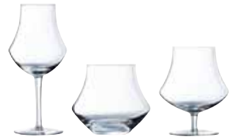
アンビアント U1062(6ヶ入)

〈ROC-51〉 5-1837-0501 ¥12,000 φ72(口径φ57)×H234 200c. c.