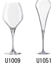
スイート 27 U1009 (6ヶ入)

〈ROC-49〉 5-1837-0301 ¥12,000 φ95(口径φ67)×H211 370c. c.