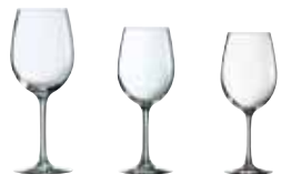
チューリップワイン 350 46973 (6ヶ入)

〈RKB-Y5〉 5-1838-0201 ¥5,700 φ89(口径68)×H220 494c. c.