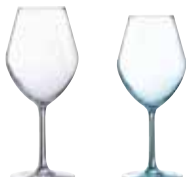
フルーティー 43 U1901 (6ヶ入)

アロマップは、ワインのアロマを探求し、楽しむためにデザインされたグラスシリーズです。アロマップのデザインはワイン2種類の香りを引き出してくれます。「フルーティー」は葡萄品種由来の果実香を、「オーキー」は熟成のための樽からもたされる複雑なアロマを引き出します。アロマップであなただけの好みの香りを探して下さい。