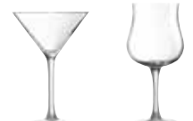
カクテル 58001 (6ヶ入)

〈RAL-93〉 5-1838-0701 ¥6,000 φ70(口径52)×H237 240c. c.