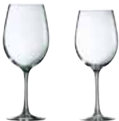
チューリップワイン 580 46888 (6ヶ入)

カベルネは、豊富なサイズを取り揃えた幅広いレンジのコレクションです。それぞれのグラスの形状や微細なリムがワインの香りや味を最大限に引き出します。デザイン面、機能面、コスト面にバランスの取れたワイングラスの新しいスタンダードです。