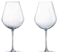
オーキー 47 U1904 (6ヶ入)

〈RAR-02〉 5-1837-1401 ¥9,600 φ83(口径φ52)×H196 350c. c.