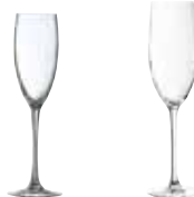
フルート 160 48024 (6ヶ入)

〈RAL-90〉 5-1838-0501 ¥4,200 φ66(口径53)×H167 190c. c.