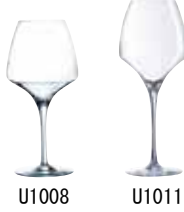
プロ・テイスティング 32 U1008 (6ヶ入)

〈ROC-56〉 5-1837-1202 ¥12,000 φ100(口径62)×H132 390c. c.