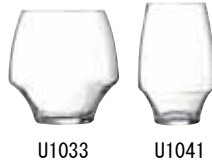
マルテグラス U1033 (6ヶ入)

〈ROC-48〉 5-1837-0701 ¥12,000 φ89(口径φ60)×H231 400c. c.