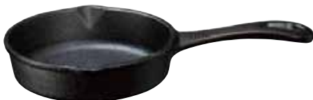
鉄鑄物 スキレット 〈ASK-67〉

ハンバーグやステーキ、餃子にアヒージョetc... 器としてテーブルにサーブすれば素材の旨みも逃しません!