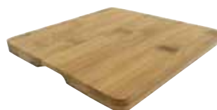
鉄鑄物 スキレット用木台 〈ASK-68〉