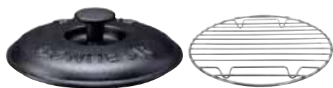
鉄鑄物 スキレット用蓋 (網付) 〈ASK-70〉