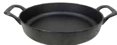
鉄鑄物 スキレット 両手 〈ASK-69〉