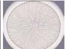
本体アルマイト加工