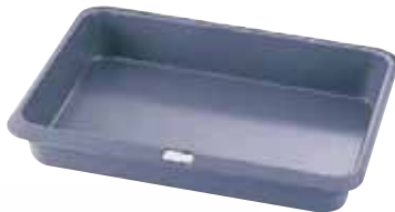
ラージ レクタングル オープンパン 38×28cm 〈WGL-10〉 5-0823-0901 ¥7,200 408×330×H65 内寸380×280 (360×260)