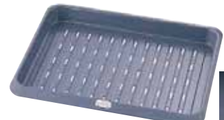
レクタングル プロイラートレイ 38×28cm 〈WGL-12〉 5-0823-1101 ¥6,100 408×330×H30 内寸380×280 (370×270) ●オープンパンにセットすれば肉などの脂分 を落とすことができ、ヘルシーに仕上げられます。