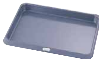
レクタングル オープントレイ 38×28cm 〈WGL-11〉 5-0823-1001 ¥6,000 408×330×H30 内寸380×280 (370×270)