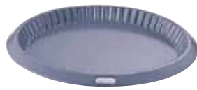
ラージラウンドオープンパン 12インチ (タルトパン) 〈WGL-16〉 5-0823-1501 ¥4,700 φ350×H30 内径305 (280)