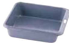
ディープ レクタングル オープンパン 28×23cm 〈WGL-13〉 5-0823-1201 ¥5,400 250×280×H70 内寸220×240 (200×220)