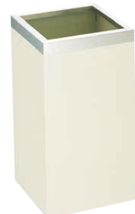
④ 傘立 KK-250 〈ZKS-09〉 1-2590-0401 ¥49,000 250×250×H450 スチール焼付け塗装