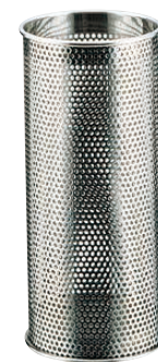
⑨ 傘立メッシュ傘プラ 〈ZKS-24〉 1-2590-0901 ¥40,000 φ215×H470 ステンレスヘアライン 仕上げ ●天地を逆にすると深さ30mmの プランター台にも兼用できます。