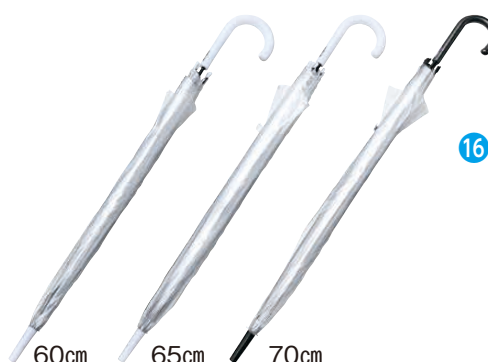
⑯ ビニールジャンプ傘(透明) 〈ZKS-A7〉 cm 1-2590-1601 60 ¥700 1-2590-1602 65 ¥750 1-2590-1603 70 ¥980 ●親骨がグラスファイバー骨なので風に強く丈夫です。 ●ワンタッチ式