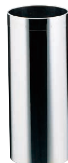
⑧ 傘立ドリーム 〈ZKS-23〉 1-2590-0801 ¥29,000 φ205×H475 ステンレスミラー仕上げ