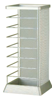
⑬ 角型 MR-SV 〈ZKS-73〉 1-2590-1301 ¥3,500 215×215×H450