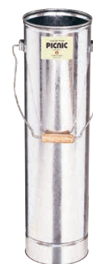
⑭ オバケツ 傘立て AKD495 〈ZKS-96〉 1-2590-1401 ¥3,500 φ135×H495 材質:トタン材(亜鉛メッキ鋼板) ●錆に強く屋外でも使用可能。 ●底には転倒防止用の重し(約700g)入れてあります。