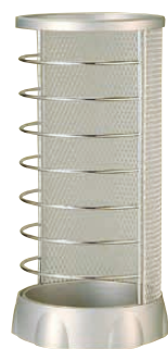
傘立てXチェンジ ⑫ 丸型 MR-SV 〈ZKS-72〉 1-2590-1201 ¥3,500 225×225×H450 ⑫⑬材質:本体 スチール (粉体塗装・クロームメッキ)