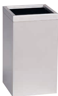
② 傘立 AK-250 〈ZKS-08〉 1-2590-0201 ¥67,000 250×250×H450 ステンレス ヘアライン仕上げ