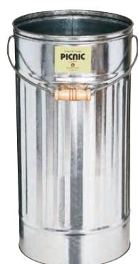
⑮ 傘立て KD-82 〈TNR-45〉 1-2590-1501 ¥4,800 φ245×H495 材質:トタン材(亜鉛メッキ鋼板) ●屋根材にも使われているトタン材なので、錆びに強く屋外でも 使用できます。 ●水を入れても使えるように水漏れ防止加工を施しています。