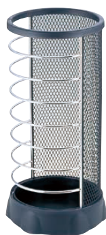
傘立てXチェンジ ⑩ 丸型 MR-BK 〈ZKS-63〉 1-2590-1001 ¥3,200 225×225×H450 ⑩⑪材質:本体 スチール (粉体塗装・クロームメッキ)