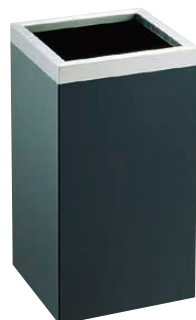
⑥ 傘立 AKK-250 〈ZKS-10〉 1-2590-0601 ¥49,000 250×250×H450 スチール焼付け塗装