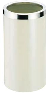
③ 傘立 KS-250 〈ZKS-12〉 1-2590-0301 ¥37,000 φ250×H450 スチール焼付け塗装