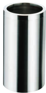
① 傘立 AM-250 〈ZKS-11〉 1-2590-0101 ¥56,000 φ250×H450 ステンレス ヘアライン仕上げ