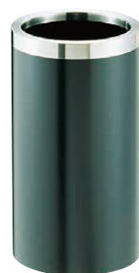
⑤ 傘立 AKS-250 〈ZKS-13〉 1-2590-0501 ¥37,000 φ250×H450 スチール焼付け塗装