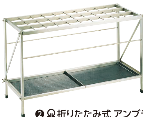
② Ω 折りたたみ式 アンブラー S-30F (30本立)

730×260×H510 折りたたみ時:730×70×H735 ステンレスヘアライン仕上げ