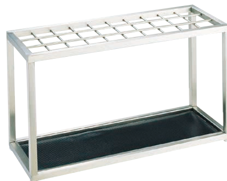
⑥ Ω アンブラーS-30U (30本立)