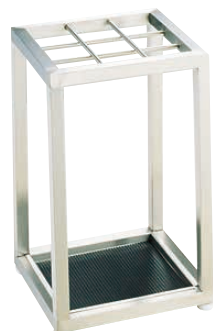
④ Ω アンブラーS-9U (9本立)

1,000×360×H510 折りたたみ時:1,010×120×H820 ステンレスヘアライン仕上げ