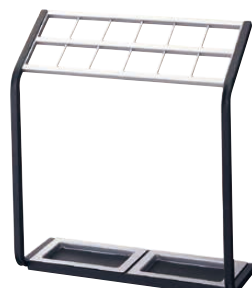
⑨ かさたて US-MVII (12本立)