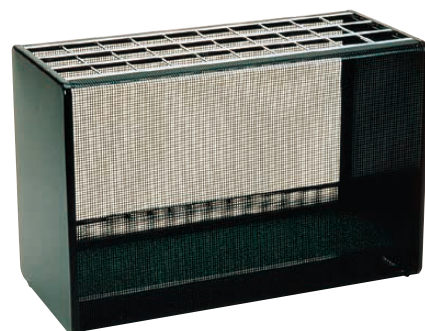
⑧ アンブラー 〈ZAV-16〉