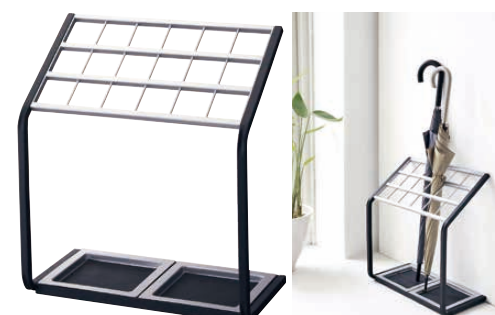
⑩ かさたて US-MV (18本立)