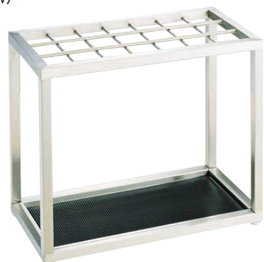
⑤ Ω アンブラーS-21U (21本立)