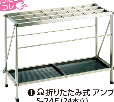
① Ω 折りたたみ式 アンブラー S-24F (24本立)