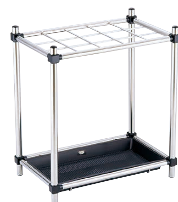
⑦ 18-8 傘立て S-59