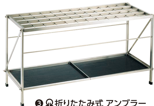
③ Ω 折りたたみ式 アンブラー S-48F (48本立)

860×320×H510 折りたたみ時:860×100×H790 ステンレスヘアライン仕上げ