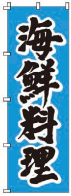
⑩ 1-503 海鮮料理 P 〈YNB-P9〉 1-2568-1001 600×1,800 ¥2,800