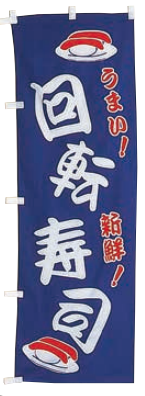
㉗ UF-1037 回転寿司 〈YNB-I5〉 1-2568-2701 600×1,800 ¥4,100