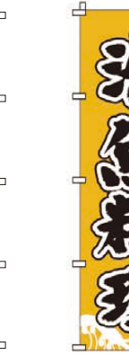
⑧ 1-501 活魚料理 P 〈YNB-P7〉 1-2568-0801 600×1,800 ¥2,800