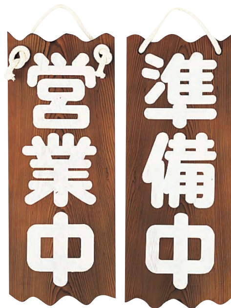
㉑ 特大ネズコ 営業中/準備中 <PPL-49> ⑥ 1-2563-2101 ¥10,500 280×720