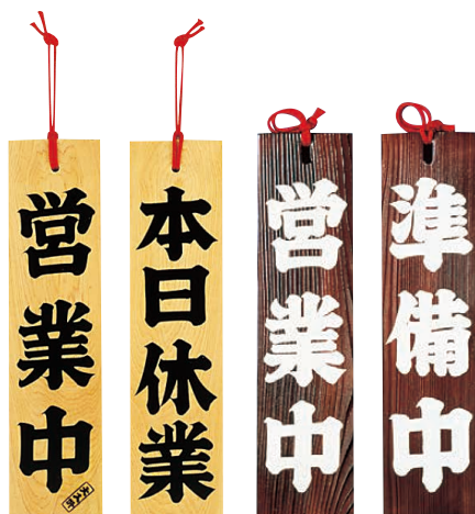
⑭ ⑮ ⑭ ひのき 営業中/本日休業 <PPL-47> ⑥ 1-2563-1401 ¥3,150 100×420 ⑮ ネズコ 営業中/準備中 <PPL-39> ⑥ 1-2563-1501 ¥2,700 100×420