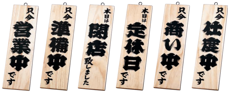
⑤ ⑥ ⑦ ⑧