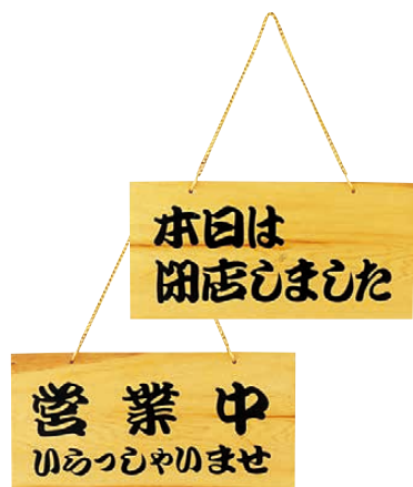
⑱ ひのき POPプレート <PPL-71> ⑥ 1-2563-1801 ¥3,850 400×190 表:営業中 裏:本日は閉店しました