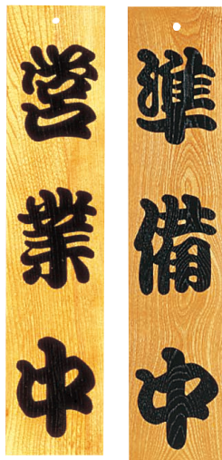
⑳ ケヤキ 営業中/準備中 <PPL-34> ⑥ 1-2563-2001 ¥8,000 130×600