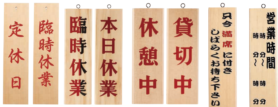
⑨ ⑩ ⑪ ⑫ ⑬ ⑨ 木理-130 定休日/臨時休業 <YHD-01> ⑥ 1-2563-0901 ¥3,100 100×400 ⑩ 木理-7 臨時休業/本日休業 <PPL-C9> ⑥ 1-2563-1001 ¥2,700 100×350 ⑪ 木理-8 休憩中/貸切中 <PPL-D0> ⑥ 1-2563-1101 ¥2,500 100×300 ⑨~⑪材質:木製 ⑫ 木理-9 (白木) 只今満席 (片面) <ZKV-41> ⑥ 1-2563-1201 ¥2,600 100×350 ⑬ 木理-10 (白木) 営業時間 (片面) <ZKV-44> ⑥ 1-2563-1301 ¥2,500 100×350