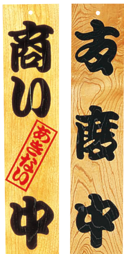
⑲ ケヤキ 商い中/支度中 <PPL-33> ⑥ 1-2563-1901 ¥8,000 130×600