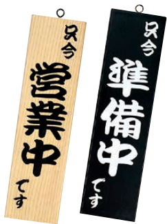
① シンビ 営業中サイン 粹-10 <PTV-93> ⑤ ¥2,800 1-2563-0101 白木 1-2563-0102 黒 100×350 表:営業中 裏:準備中

料理道具 調理小物 調理機械 厨房機器・設備 サービス用品 喫茶用品 軽食・製菓用品 棚・ワゴン 洗濯用 清掃用品 長靴白衣・消耗品 バンケットウェア フラットウェア テーブルウェア 卓上備品 料理演出用品 グラス・食器 ホテル・旅館用品 テーブル椅子 サイン 店舗備品