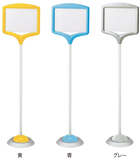
黄 青 グレー

料理道具 調理小物 調理機械 厨房機器・設備 サービス用品 喫茶用品 軽食・鉄板焼用品 製菓用品 フコ 洗濯用 清掃用品 長靴白衣・消耗品 バンケットウェア フラットウェア テーブルウェア 卓上備品 料理演出用品 グラス・食器 ホテル・旅館用品 テーブル椅子 サイン 店舗備品