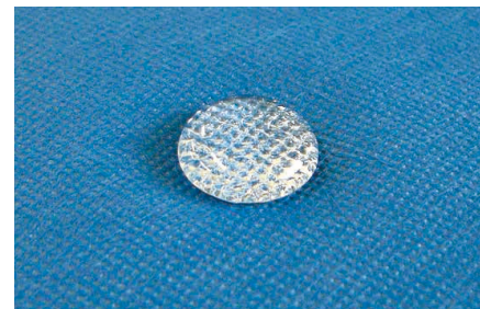
強撥水効果で拭き取り簡単。