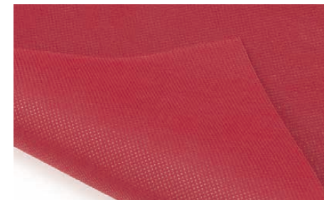
両面使えて経済的。