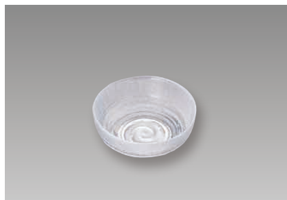
硝子和食器 淡路ライン(ガラス製)

硝子和食器(ガラス製) ※すべて手造りですので、形・色・寸法に多少の相違があります。