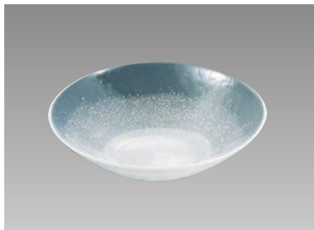
9 白雪15 40センチ 丸盛込皿 <RML-31> ■ 1-2401-0901 ¥17,000 φ400×H100