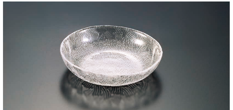
20 雪波 中華皿 <RTY-54> ■ 1-2401-2001 ¥2,500 φ210×H40

料理道具 調理小物 調理機械 厨房機器・設備 サービス用品 喫茶用品 軽食・鉄板焼用品 製菓用品 ワゴン 洗濯用 清掃用品 長靴白衣・衛生 消耗品 バンケットウェア フラットウェア テーブルウェア 卓上備品 料理演出用品 ガラス・食器 ホテル・旅館用品 テーブル・椅子 サイン 店舗備品