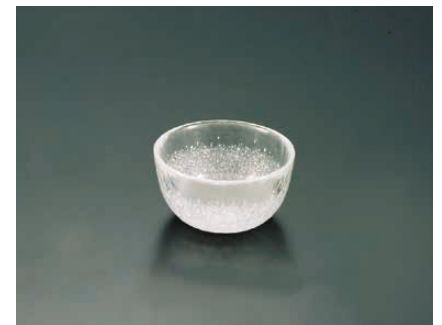
13 白雪19 丸深鉢 <RML-35> ■ 1-2401-1301 ¥1,700 φ110×H60