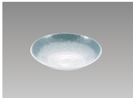
10 白雪16 31センチ 丸盛込皿 <RML-32> ■ 1-2401-1001 ¥7,200 φ310×H67