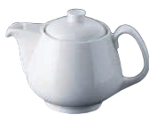
⑰ 34211 ティーポット1人用 〈RLC-C8〉 ☑ 1-2353-1701 ¥9,800 L:160 S:104 H:105 C:380c.c.