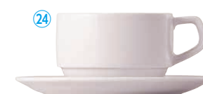
㉔ 34697 カップL スタッキング 〈RLC-S6〉 ☑ 1-2353-2401 ¥2,900 L:108 S:84 H:67 C:220c.c.