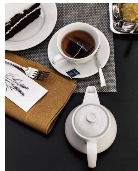
⑭ 34851 兼用ソーサー 〈RLC-C1〉 ☑ 1-2353-1401 ¥1,500 D:150 H:20