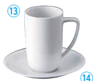
⑬ 34865 コーヒーカップ (L) 〈RLC-C2〉 ☑ 1-2353-1301 ¥3,400 D:69 H:118 C:250c.c.