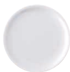
㉔ 30021 クーププレート 21cm 〈RLC-Y8〉 ☑ 1-2353-2001 ¥2,600 D:210 H:21