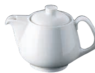
⑱ 34221 ティーポット3人用 〈RLC-C9〉 ☑ 1-2353-1801 ¥20,000 L:188 S:120 H:125 C:600c.c.