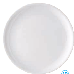
⑲ 30028 クーププレート 28cm 〈RLC-Y7〉 ☑ 1-2353-1901 ¥5,600 D:280 H:26