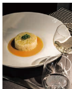
㉒ 31528 グルメプレート 28cm 〈RLC-S0〉 ☑ 1-2353-2201 ¥5,800 D:278 H:60