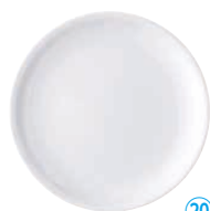
⑳ 30016 クーププレート 16cm 〈RLC-Y9〉 ☑ 1-2353-2101 ¥1,800 D:158 H:17