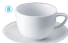
⑧ 34676 カフェ・ラテカップ 〈RLC-C6〉 ☑ 1-2353-0801 ¥3,900 D:105 H:78 C:380c.c.