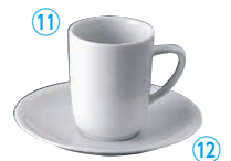
⑪ 34862 コーヒーカップ (M) 〈RLC-C0〉 ☑ 1-2353-1101 ¥3,100 D:65 H:85 C:180c.c.