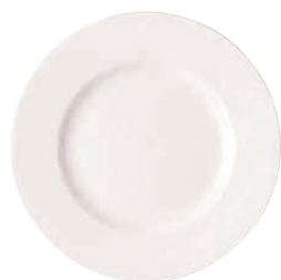
① 31163 サービスプレートフラット 33cm 〈RLC-R4〉 ☑ 1-2353-0101 ¥8,000 D:330 H:22