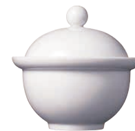
⑩ 30751 グルメカップL 360c.c. 〈RLC-R8〉 ☑ 1-2353-1001 ¥8,600 D:135 H:130