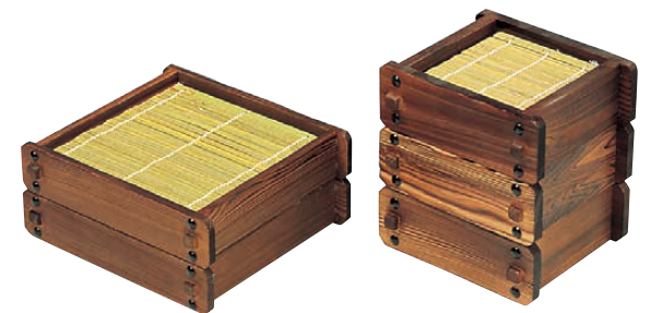
⑬ ネズコ 角セイロ 〈QKK-12〉 ¥5,000

〈QHK-33〉B 1-2170-1201 ¥18,000 材質しな ウレタン塗装 本体/320×135×H55 盛皿/380×100×H20 竹ス/298×113 ●単品のそばメニューはもちろん、竹すだれを取り、盛皿、盛台、お料理箱として活用できます。