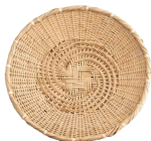
⑭ 白竹 そばザル 〈QZL-16〉

1-2170-1301 大 200×200×H50 1-2170-1302 小 145×145×H60