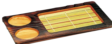
⑤ 焼杉 薬味付もり