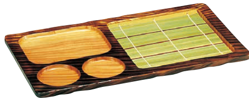
④ 焼杉 天ざる