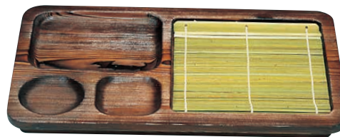
⑧ ネズコ 天ぷらそば盆