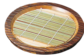
③ 焼杉 盆ざる N-81

〈QBV-11〉B 1-2170-0201 ¥6,390 φ240×H25 ※写真のチョコと薬味入れは別売です。 (P.2171⑫⑬を参照ください。)