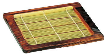
⑦ 焼杉 正角ざる