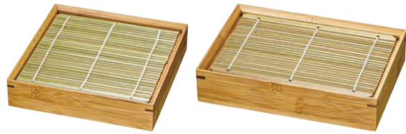
① 竹製 炭化麵皿 (EKT-77)

1-2170-0101 正角 180×180×H47 ¥5,150 1-2170-0102 長角 185×125×H47 ¥4,840