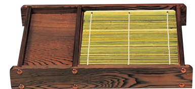
⑨ ネズコ 天ぷらセイロ