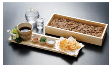
⑫ 桧 箱そばセット NB-204

1-2170-1101 大・足付 21438 345×185×H50 ¥8,200 1-2170-1102 小 21436 322×182×H38 ¥6,950