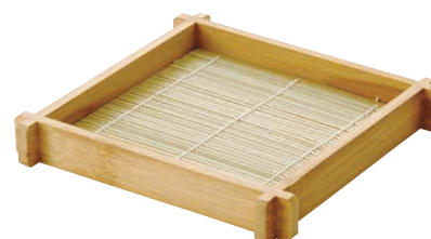
⑮ スス そば盛 スタッキング型

1-2170-1401 8寸 φ240×H25 ¥3,710 1-2170-1402 7寸 φ210×H25 ¥3,510 1-2170-1403 6寸 φ180×H25 ¥3,160