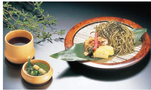
② 栃 盆ざる

1-2170-0101 正角 180×180×H47 ¥5,150 1-2170-0102 長角 185×125×H47 ¥4,840