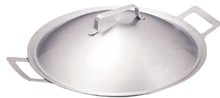
※②ドンナム チゲグリルパンセットイメージ