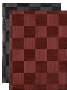
② シンビ メニューブック LS-112 (PAA-85) 価格 ¥3,050

230×320(A4・ビニール付4ページ) (中紙 洋-74V/ビニール-55) ●モダンな新市松柄で和風、洋風どちらもご使用できます。 ●クリップ式