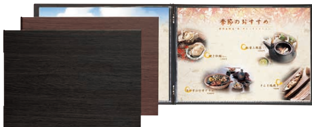
⑧ シンビ メニューブック LS-18 (PSV-63) 価格 ¥3,100

230×315(A4・ビニール付4ページ) (中紙 洋-74V/ビニール-55) ●クリップ式