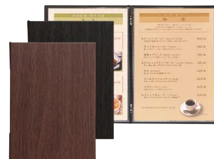
⑨ シンビ メニューブック LS-19 (PSV-61) 価格 ¥2,100

225×315(A4ヨコ・ビニール付4ページ) (ビニール-73) 材質:ビニールペーパー ●メニューピン仕様