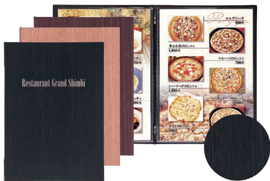
⑦ シンビ メニューブック LS-11 (PAA-88) 価格 ¥3,250

180×315(ビニール付4ページ) (ビニール-69) 材質:ビニールペーパー ●レール式 ●10ページまで増減可能