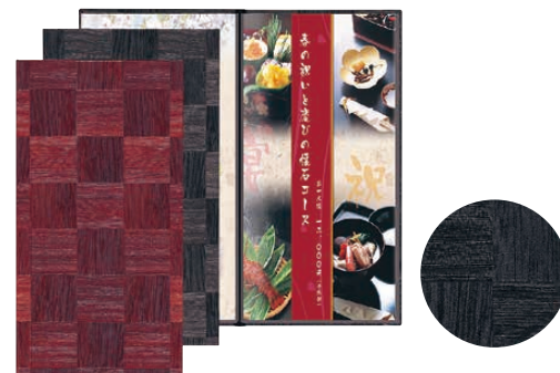
⑥ シンビ メニューブック LS-116 (PMB-18) 価格 ¥3,100

225×163(A5・ビニール付4ページ) (ビニール-74) 材質:ビニールペーパー ●メニューピン仕様