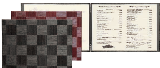
④ シンビ メニューブック LS-118 (PSV-64) 価格 ¥3,100

278×205(ヨコB5ビニール付4ページ) (中紙 洋-80V/ビニール-65) ●クリップ式