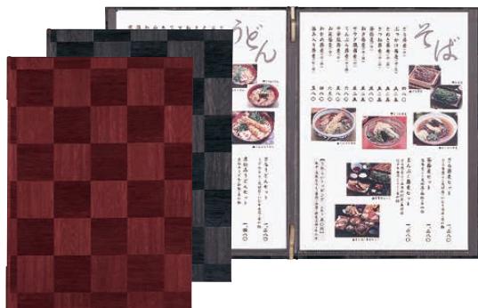
① シンビ メニューブック LS-111 (PAA-13) 価格 ¥3,250

料理道具 調理小物 調理機械 厨房機器・設備 サービス用品 喫茶用品 軽食・製菓用品 棚・ワゴン 洗浄用ラック 清掃用品 長靴・白衣・衛生 消耗品 バンケットウェア フラットウェア テーブルウェア 卓上備品 料理演出用品 グラス・食器 ホテル・旅館用品 テーブル・椅子 サイン 店舗備品