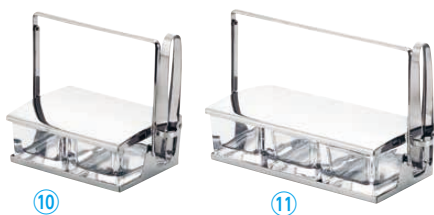
⑩ ガラス 薬味入れ No.825 (2ヶ仕切) (PYK-17) 1-2006-1001 ¥5,500 135×80×H111 ※トンブ付