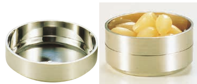
① Ω 18-8 バターディッシュ (PZL-08) 1-2006-0101 03 φ105×H27 ¥2,800 1-2006-0102 04 φ 90×H25 ¥2,600

おつまみ、薬味入れに最適です。 つや消し加工のため、くもりが目立ちません。 積み重ねができるので、スペースを取りません。