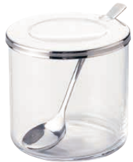
⑤ ガラス 薬味入れ No.851 (PYK-41) 1-2006-0501 ¥1,600 92×83×H83 容量300c.c.