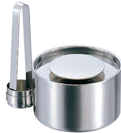
② モリブデン ガリ・薬味入れ (トンブ付) MR-495 (PGL-65) 1-2006-0201 ¥4,000 100×133×H63 400c.c. ●フタは18-8ステンレスです。 ●トンブスタンドは外れます。