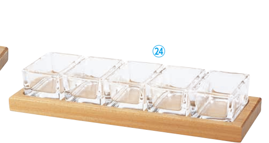
㉔ ガラス薬味入れ No.685 (PYK-36) 1-2006-2401 ¥8,800 282×97×H50 ガラス伸子:76×50×H39