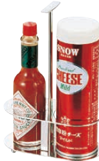
⑥ No.4200 粉チーズ・ タバスコ入れ (PEM-63) 1-2006-0601 ¥3,500 115×60×H170 内φ40・φ50 ※写真の粉チーズ、タバスコは付属 されていません。