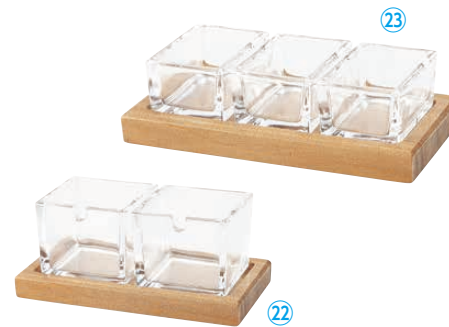
㉒ ガラス薬味入れ No.672 (PYK-37) 1-2006-2201 ¥6,700 180×97×H78 ガラス伸子:75×75×H65