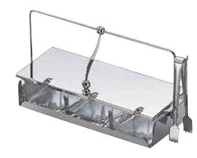
⑬ ガラス 薬味入れ T-103 (3ヶ仕切) (PYK-14) 1-2006-1601 ¥10,300 183×85×H113 ※トンブ付