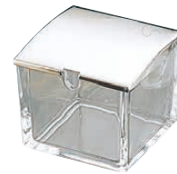
⑦ ガラス 薬味入れ No.871 (PYK-27) 1-2006-0701 ¥3,300 78×78×H70