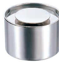
③ モリブデン スリムポット400 MR-492 (PPT-40) 1-2006-0301 ¥4,000 φ100×H63 400c.c. ●フタは18-8ステンレスです。