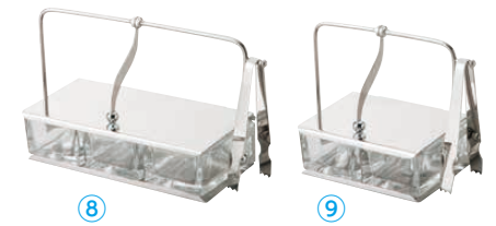
⑧ ガラス 薬味入れ No.553 (3ヶ仕切) (PYK-08) 1-2006-0801 ¥9,000 187×80×H116 ※トンブ付