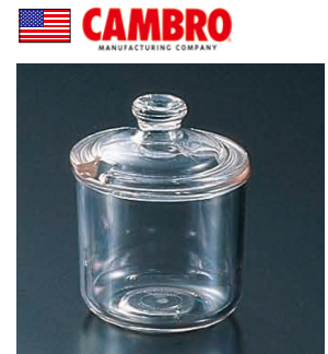
④ キャンブロコンジメントジャー CJ80CW(ポリカーボネイト) 洗 (AKV-20) 1-2006-0401 ¥2,800 φ83×H102 240c.c. ●マスタード・ドレッシング・ゼリー・ ジャム等の容器に最適です。 ●蓋は便利な切り込み付。(耐熱99℃)