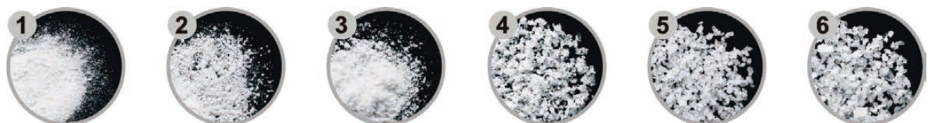
ソルトミル 6段階の粗さ調節が可能。