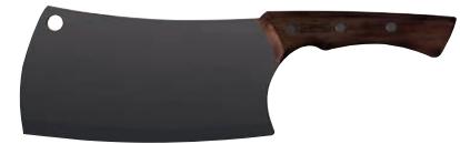
⑥ 中華包丁 22845/107 〈OTL-A4〉 1-1886-0601 ¥6,600 全長:320 刃渡り:175 450g