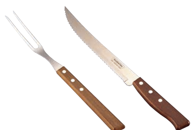
⑪ トラモンティーナ カービングセット 22299/012 〈OTL-24〉 1-1886-1101 ¥6,400 ナイフ/全長:350 刃渡り:約210 フォーク/全長:325