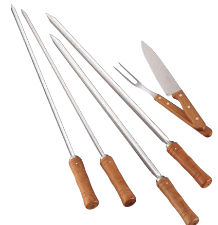
⑦ トラモンティーナ BBQスクエア シングル 〈OTL-25〉 B CM 全長 串部分 1-1886-0701 26417/065 65 650 510 ¥3,000 1-1886-0702 26417/075 75 750 610 ¥3,100