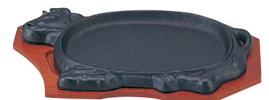
⑬ トキワ ステーキ皿 312 アニマル 〈PTK-12〉 B 1-1880-1301 ¥5,400