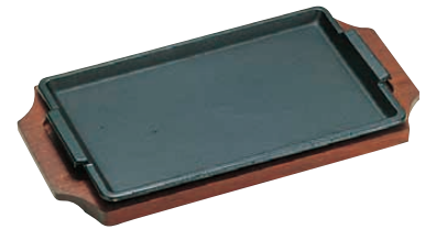
⑤ トキワ ステーキ皿 322デラックス角S型 〈PTK-15〉 B 1-1880-0501 ¥5,000