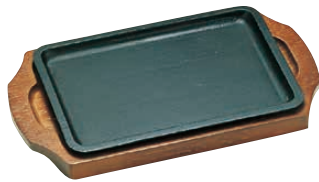
③ トキワ ステーキ皿 309 長方形 〈PTK-06〉 B