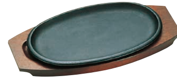
② トキワ ステーキ皿 316 小判浅型 〈PTK-08〉 B