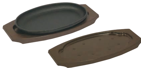
⑭ トキワ 樹脂製台ステーキ皿 小判型 〈PTK-53〉 B