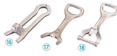
⑯ トキワ 712 ハンドル