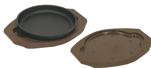
⑮ トキワ 樹脂製台ステーキ皿 丸型 〈PTK-54〉 B