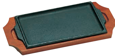
④ トキワ ステーキ皿 308 角型 〈PTK-05〉 B