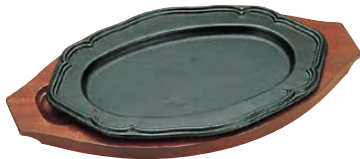
⑥ トキワ ステーキ皿 314 花型 〈PTK-09〉 B 1-1880-0601 ¥4,700