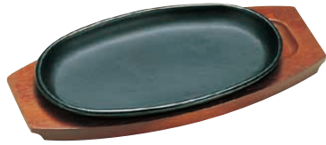
① トキワ ステーキ皿 301 小判 〈PTK-07〉 B