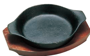
⑫ トキワ ステーキ皿 306 深型丸 〈PTK-28〉 B