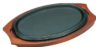
⑦ トキワ ステーキ皿 323 ライン 〈PTK-20〉 B 1-1880-0701 ¥4,700