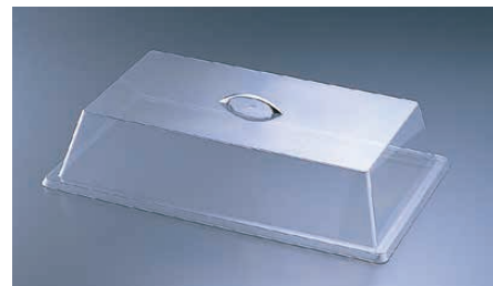
⑦ スタダード 327-12

〈PKB-11〉 1-1782-0601 ¥37,500 535×335×H205