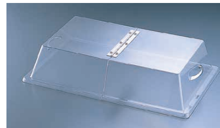
⑧ センターヒンジ 328-12

〈PKB-12〉 1-1782-0701 ¥37,500 535×335×H133