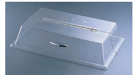
⑨ ロングヒンジ 329-12

〈PKB-13〉 1-1782-0801 ¥50,600 535×335×H110