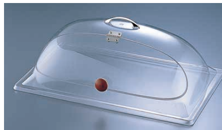
⑩ カル・ミル チェーフィングカバー サイドカット 367-12

〈PKB-14〉 1-1782-0901 ¥50,600 535×335×H110