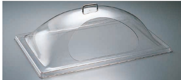
② 角ドームカバー サイドカット

1-1782-0101 DD1220CW 550×355×H200 ¥17,500 1-1782-0102 DD1826CW 680×480×H215 ¥24,500