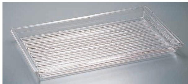
⑤ 角ディスプレイトレイ DT1220CW

1-1782-0401 RD1220CW 550×355×H140 ¥18,500 1-1782-0402 RD1826CW 680×475×H150 ¥24,000