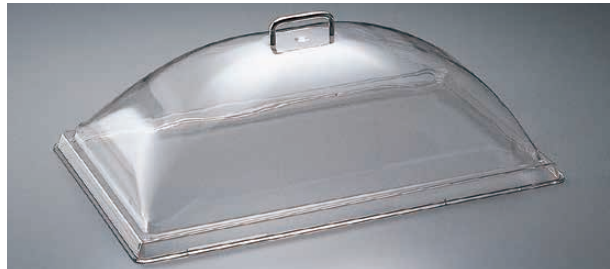
① 角ドームカバー 〈PKK-28〉

気品漂よう透明感が美しさを引きだします。 ポリカーボネイト製で耐久性に優れています。