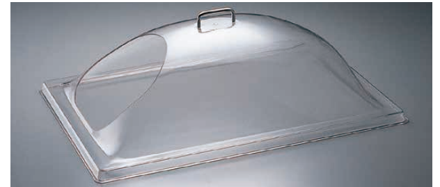
③ 角ドームカバー ワンエンドカット 〈PKK-29〉

DD1220SCW 〈PKK-30〉 1-1782-0201 ¥22,000 550×355×H200