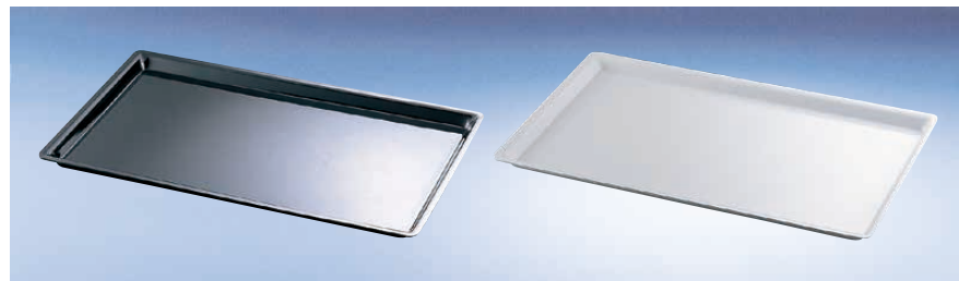
⑪ カル・ミル アクリル シャロートレー

〈PKB-10〉 1-1782-1001 ¥59,300 535×335×H200 ●チェーフィングディッシュ 1/1サイズに 使用できます。