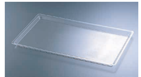
⑫ カル・ミル スリムライン シャロートレー クリアー P232-12

〈PSY-E7〉 ¥39,400 1-1782-1101 325-12-13 ブラック 1-1782-1102 325-12-15 ホワイト 524×321×H22