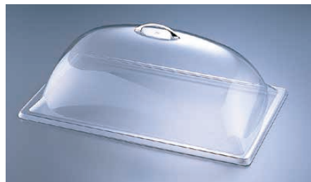
⑥ ドーム 321-12

●カル・ミルのポリカーボネイトカバーはガストロノーム規格の 1/1サイズにご使用できます。