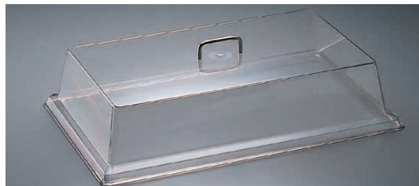
④ 角フラットカバー 〈PKK-32〉

1-1782-0301 DD1220ECW 550×355×H200 ¥22,000 1-1782-0302 DD1826ECW 680×480×H215 ¥18,000