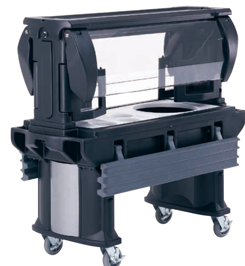
スーニーズガードやトレーレールは、可変式なのでセットアップが簡単