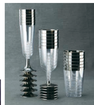
スタッキング可能