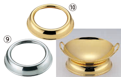
TKG 18-8 プチ中華受け台