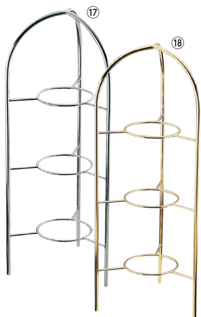
TKG 18-8 プチ中華シリーズ用 3段スタンド