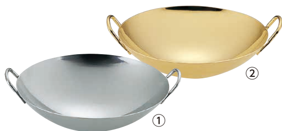
TKG 18-8 プチ中華鍋