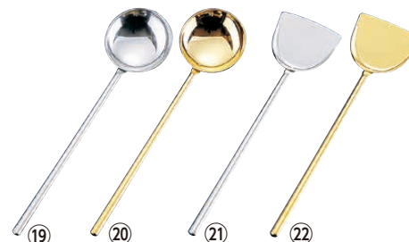
TKG 18-8 プチ中華お玉