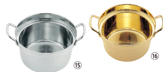
TKG 18-8 プチセイロ 鍋