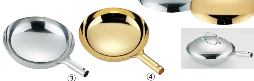
TKG 18-8 プチ北京鍋