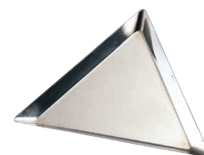
㉓ 18-8 三角トレー (PSV-51) 1-1707-2301 ¥1,410 125×125×H8