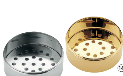
TKG 18-8 プチセイロ 身