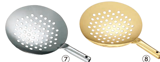
TKG 18-8 プチチャーレン鍋