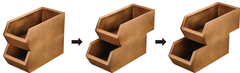
3箇所でスタッキング可能です。

(EOC-33) 目録 ¥7,500 1-1701-0701 ブラック 1-1701-0702 ダークブラウン 1-1701-0703 ナチュラル 270×130×H105 内220×105×H87 材質:ブナ材(ウレタン塗装仕上げ) ●重厚感とシンプルさを兼ね備えたオーガナイザーボックスです。 ●2段まではボックス単体で自立する安定構造です。