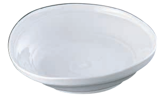
⑫ 白釉たわみ8.0大皿 深B03-35

<ROO-37> 1-1687-1101 ¥8,000 φ250×H60 ●美濃焼