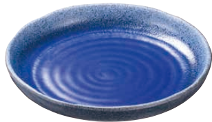
⑬ 海蒼9.0深丸皿 B03-50

<ROO-47> 1-1687-0601 ¥9,100 335×180×H40 ●瀬戸焼