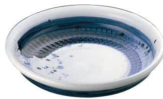
⑩ ごす刷毛目8.0大皿 深B03-34

NEW <NML-B8> 1-1687-1401 ¥8,300 φ310×H60 ●萬古焼