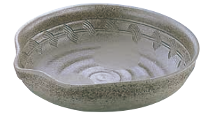
⑧ 炭化土ぼたもち 8.5大皿 深 B03-30

<ROO-32> 1-1687-0701 ¥15,500 320×310×H65 ●瀬戸焼