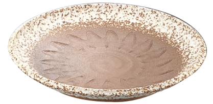
② 手造赤土白吹12.0大皿 平 B03-20

1-1687-0101 C194 φ311×H 75 ¥ 4,900 1-1687-0102 C195 φ366×H 85 ¥ 7,000 1-1687-0103 C196 φ421×H115 ¥10,800