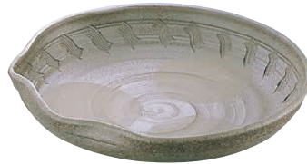
⑦ 炭化土ぼたもち 11.0大皿 深 B03-29

NEW <NML-B7> 1-1687-1301 ¥9,600 φ270×H45 ●瀬戸焼