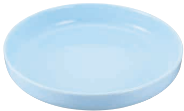
⑭ 青地10.0盛鉢 B03-51

<ROO-33> 1-1687-0801 ¥10,400 265×245×H65 ●瀬戸焼