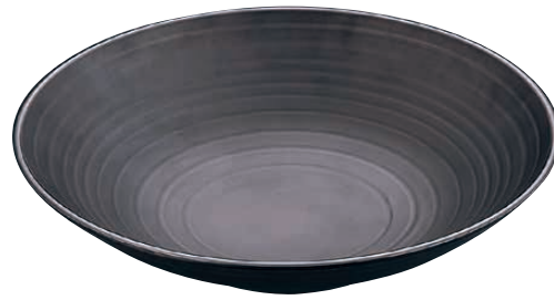
① JB メラミン 艶消し大鉢 洗 <NTY-01>

1-1687-0101 C194 φ311×H 75 ¥ 4,900 1-1687-0102 C195 φ366×H 85 ¥ 7,000 1-1687-0103 C196 φ421×H115 ¥10,800