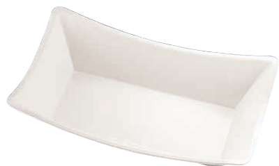
③ レクタングル MGMT2113 〈NGL-15〉 1-1680-0301 ¥10,700 527×330×H125