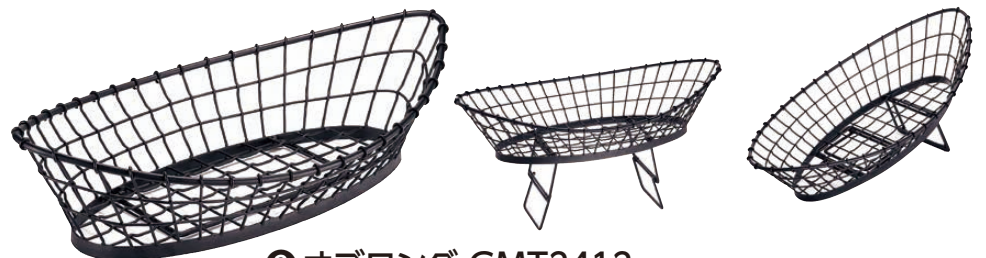
② オブロング GMT2412 〈NGL-11〉 1-1680-0201 ¥30,200 610×330×H135・300(高さ2段階調節式)