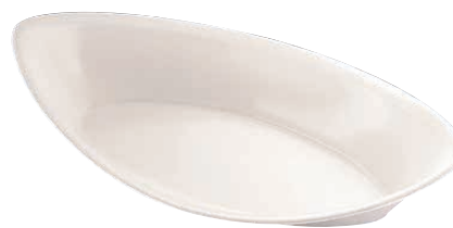
④ オブロング MGMT2412 〈NGL-14〉 1-1680-0401 ¥11,100 615×330×H145