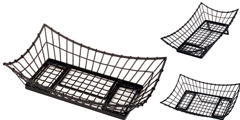
① レクタングル GMT2113 〈NGL-12〉 1-1680-0101 ¥30,200 530×335×H140・220・290 (高さ2段階調節式)