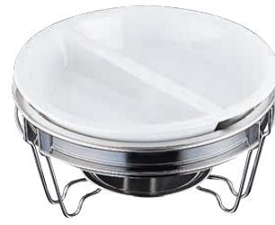
② 陶器I型仕切付中皿 〈NTE-M0〉 1-1653-0201 ¥64,000 φ390×H200 1.3ℓ×2