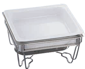
⑥ 3コンパートメント (陶器1/3サイズ) 〈NTE-L6〉 1-1653-0601 ¥86,400 554×355×H195 1.5ℓ×3