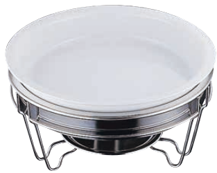
① 陶器仕切無中皿 〈NTE-L9〉 1-1653-0101 ¥60,000 φ390×H200 3.5ℓ