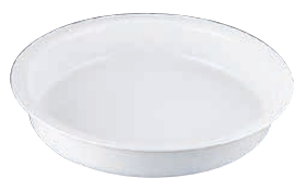
⑧ 2/3サイズ 2コンパートメント (陶器1/3サイズ) 〈NTE-L8〉 1-1653-0801 ¥60,500 360×340×H195 1.5ℓ×2