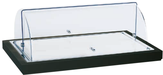
⑤ ブロジ クーリングトレイカバー付 ブラック 3050554577 〈BRO-12〉 目 1-1638-0501 ¥184,000 550×345×H200 材質:トレイ ポリエチレン、カバー SAN、 ウォールナット、ステンレス、保冷剤