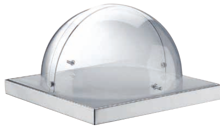
② AB クーリングディッシュ(カバー付) スクエア V760554 T01 〈ABE-02〉 目 1-1638-0201 ¥110,000 380×380×H230 材質:トレイ ポリエチレン、カバー SAN、 ステンレス、保冷剤