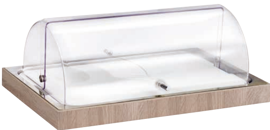
⑦ アベルト クーリングトレイ(カバー付き) V760554 R01R 〈ABE-01〉 目 1-1638-0701 ¥112,000 500×300×H200 材質:トレイ ポリエチレン、カバー SAN MDF、ステンレス、保冷剤

ブラックを基調としたシンプルなデザイン。軽さと丈夫さを兼ね添えています。 カーボンファイバーを使用し、ディナープレート3~4枚乗せることが可能なサイズで1,010gの軽量化を実現。 ストレスのないモダンでスタイリッシュなサービスを可能にします。