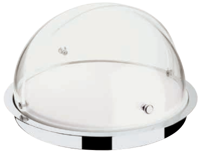
① ブロジ クーリングプラター ドームカバー付 V770554 T46R 〈BRO-10〉 目 1-1638-0101 ¥100,000 φ460×H275 材質:トレイ ポリエチレン、カバー SAN、 ステンレス、保冷剤