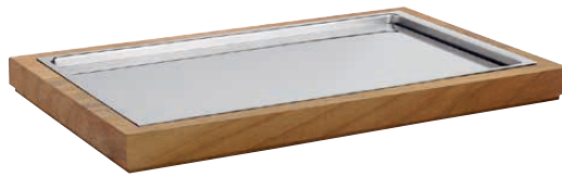
④ ブロジ クーリングトレイ ウォールナット 3055452699 〈BRO-13〉 目 1-1638-0401 ¥133,000 550×345×H45 材質:ステンレス、ウォールナット、保冷剤