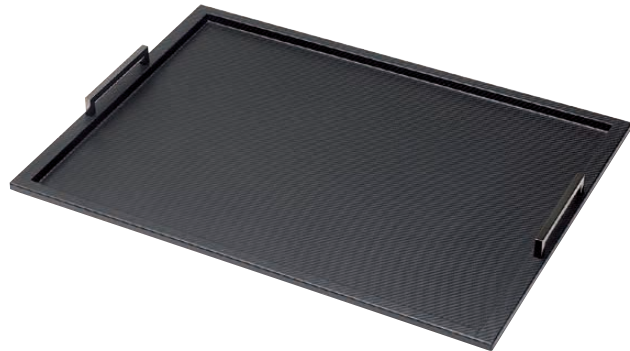
⑧ ブロジ カーボンファイバートレイ 〈BRO-08〉 目 g 1-1638-0801 小 3050523851 670×520×H15(トレイ内側 620×480) 1,010 ¥416,000 1-1638-0802 大 3050523849 770×560×H15(トレイ内側 720×520) 1,030 ¥251,000 材質:カーボンファイバー、ステンレス

ブラックを基調としたシンプルなデザイン。軽さと丈夫さを兼ね添えています。 カーボンファイバーを使用し、ディナープレート3~4枚乗せることが可能なサイズで1,010gの軽量化を実現。 ストレスのないモダンでスタイリッシュなサービスを可能にします。