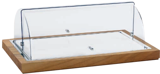
③ ブロジ クーリングトレイカバー付 ウォールナット 3055454577 〈BRO-11〉 目 1-1638-0301 ¥180,000 550×345×H215 材質:トレイ ポリエチレン、カバー SAN、 ウォールナット、ステンレス、保冷剤