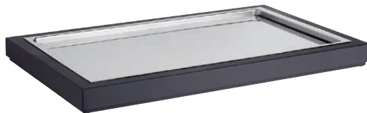
⑥ ブロジ クーリングトレイ ブラック 3050552699 〈BRO-14〉 目 1-1638-0601 ¥138,000 550×345×H40 材質:ステンレス、ウォールナット、保冷剤