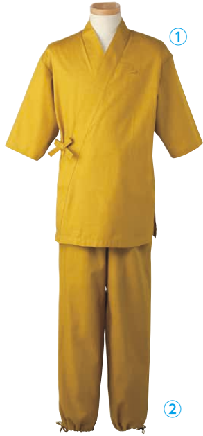
① 男女兼用 作務衣 H-2091 (カラシ) <SSM-13> B ¥6,500 1-1534-0102 LL 1-1534-0103 3L