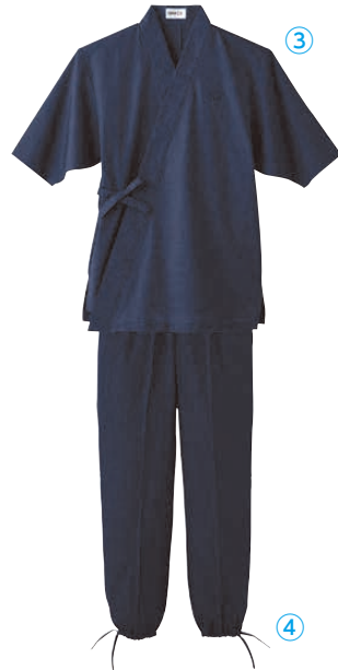
③ 男女兼用 作務衣 H-2092 (ダークブルー) <SSM-14> B ¥8,700 1-1534-0301 S 1-1534-0302 M 1-1534-0303 L 1-1534-0304 LL 1-1534-0305 3L