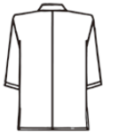
① ③ ⑥ ⑧