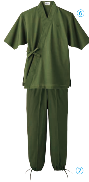
⑥ 男女兼用 作務衣 H-2093 (グリーン) <SSM-15> B ¥8,700 1-1534-0601 S 1-1534-0602 M 1-1534-0603 L 1-1534-0604 LL 1-1534-0605 3L