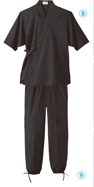
⑧ 男女兼用 作務衣 H-2094 (ブラック) <SSM-16> B ¥8,700 1-1534-0801 S 1-1534-0802 M 1-1534-0803 L 1-1534-0804 LL 1-1534-0805 3L