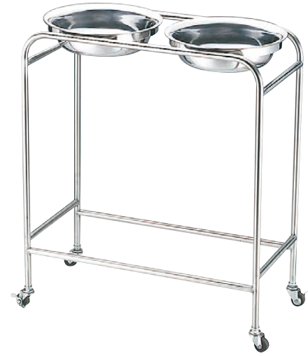
③ ΩIKD18-8 抗菌 ダブル ハンドウォッシャースタンド WKFK-88 〈AHV-59〉 1-1452-0301 ¥82,000 680×350×H800 材質:抗菌ステンレス キャスター:φ40×4自在(2ケストッパー付) ●洗面器を2つ並べて置ける事で、2種類の液体 を使い分ける事が出来ます。 又、予備としても扱えるので作業もはかどります。 ※写真の④18-0洗面器32cmは別売です。