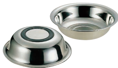
⑤ 18-8 ゴム付洗面器 〈ASV-03〉 1-1452-0501 ¥4,900 φ320(内φ270)×H85