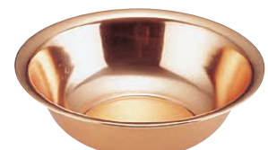
⑧ 銅 洗面器 32cm 〈ASV-49〉 1-1452-0801 ¥13,300 φ320(内φ300)×H95