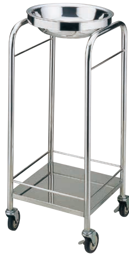
② Ω18-8 ハンドウォッシャー スタンド KF-80 〈AHV-45〉 1-1452-0201 ¥53,000 330×330×H800 リング 内φ295 キャスター:φ75×4自在(2ストッパー付) 耐荷重:50kg ●キッチンフロアで移動可能な、清潔な 手洗い車です。 ※写真の④18-0洗面器32cmは別売です。