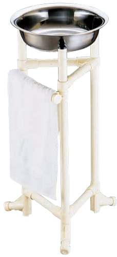
① Ωイレクター ハンドウォッシャースタンド 〈AHV-53〉 1-1452-0101 ¥22,000 410×360×H720 ●スチールパイプにABS樹脂コーティング ※写真の④18-0洗面器32cmは別売です。 ※洗面器29cm・32cmに合います。