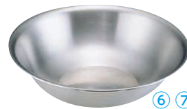
⑥ IKD18-8 抗菌洗面器 IKD18-8 〈ASV-48〉 1-1452-0601 ¥7,900 φ310×H88