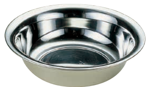
④ 18-0 洗面器 〈ASV-02〉 外径 内径 1-1452-0401 29cm 245×H80 ¥3,200 1-1452-0402 32cm 270×H87 ¥3,700