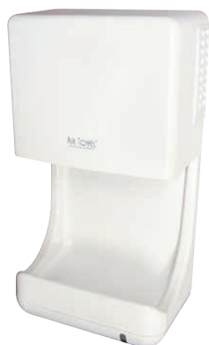
⑩ エアータオル KTM-100 〈KEA-11〉 1-1452-1001 ¥98,000 256×148×H490 電源:単相100V 50/60Hz 消費電力:ヒーターON 強650W・弱330W/OFF 強380W・弱115W 風速:強120m/秒 質量:4.7kg ●ハイパワー温風でスピード乾燥。 ●凹凸をなくした水受けカップでお手入れらくらく。 ●狭い場所へは水受けをはずして設置可能。