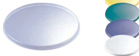
⑧ ポリプロバケツ PO-13A用蓋 PO-13B (KBK-27) ¥770

φ290×H265 容量:約13ℓ 材質:本体/ポリプロピレン つり手/18-8ステンレス