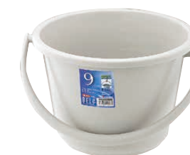
⑥ ベルク 広口バケツ グレー (KBK-51) 目