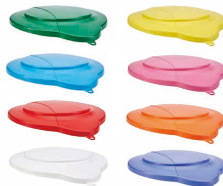
⑭ ヴァイカン バケツカバー 5687 (KBK-69) 目 ¥2,100

318×312×H325 容量:12ℓ 質量:970g 材質:ポリプロピレン(耐熱100℃) ●床に置く際床の汚れから底部を守るため高めに設計されています。 ●注ぐ際に汚れた底部に手が掛からない工夫がされています。 ●さびにくいステンレス製ハンドル。