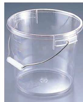
⑩ ポリカバケツ PO-15A (KBK-28) 1-1440-1001 ¥5,860

φ290×H265 容量:約13ℓ 材質:本体/ポリカーボネイト つり手/18-8ステンレス