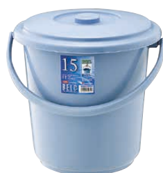
① ベルク バケツ ブルー (KBK-46) 目