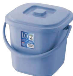
② ベルク 角バケツ ブルー (KBK-47) 目