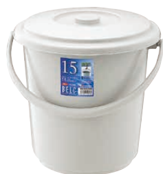
④ ベルク バケツ グレー (KBK-49) 目