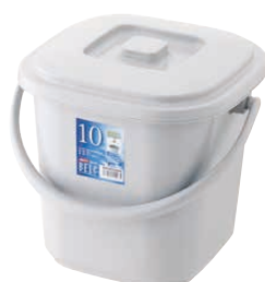
⑤ ベルク 角バケツ グレー (KBK-50) 目