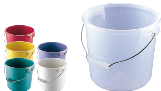
⑦ ポリプロバケツ PO-13A (KBK-26) ¥3,660