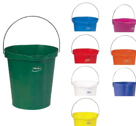
⑬ ヴァイカン ハイジーンバケツ 5686 (KBK-36) 目 ¥6,450