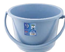
③ ベルク 広口バケツ ブルー (KBK-48) 目