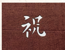
⑳ 祝-B (WSB-36) 1-1177-2001 ¥800 絵柄サイズ約37×35