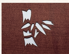
⑥ 竹-B (WSB-24) 1-1177-0601 ¥800 絵柄サイズ約48×53