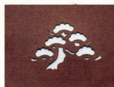
③ 松-C (WSB-21) 1-1177-0301 ¥800 絵柄サイズ約65×42