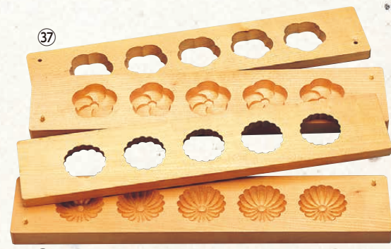
手彫物相型 五ツ取り (桜材) 425×85×H37 ③⑦ 梅 (BBT-29) 1-1177-3701 φ50×H28 ¥66,000 ③⑧ 菊 (BBT-30) 1-1177-3801 φ50×H28 ¥66,000