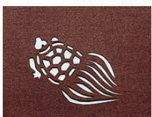
⑪ 亀 (WSB-39) 1-1177-1101 ¥800 絵柄サイズ約61×43