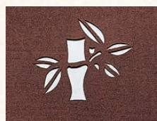
⑦ 竹-C (WSB-25) 1-1177-0701 ¥800 絵柄サイズ約62×51