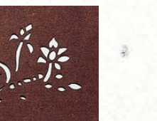
㉛ ハス-F (WSB-50) 1-1177-3101 ¥800 絵柄サイズ約52×30