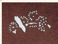
① 松-A (WSB-19) 1-1177-0101 ¥800 絵柄サイズ約71×39