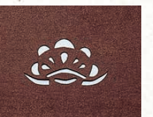
㉜ ハス-G (WSB-51) 1-1177-3201 ¥800 絵柄サイズ約31×67