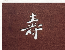
⑫ 寿-A (WSB-28) 1-1177-1201 ¥800 絵柄サイズ約34×40