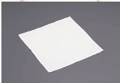
㉞ 羽二重ふきん (絹100%) (WHK-25) 1-1177-3301 ¥3,580 360×380 ●ねりきりなど和菓子の形成にご使用できます。