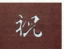
㉑ 祝-C (WSB-37) 1-1177-2101 ¥800 絵柄サイズ約41×36