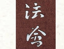
㉝ 法會 (WSB-48) 1-1177-3201 ¥800 絵柄サイズ約31×67