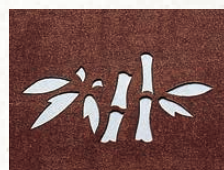
⑤ 竹-A (WSB-23) 1-1177-0501 ¥800 絵柄サイズ約83×39