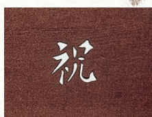
⑲ 祝-A (WSB-35) 1-1177-1901 ¥800 絵柄サイズ約31×29