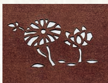
㉗ ハス-B (WSB-45) 1-1177-2701 ¥800 絵柄サイズ約82×45