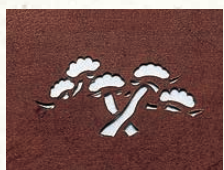
② 松-B (WSB-20) 1-1177-0201 ¥800 絵柄サイズ約73×35