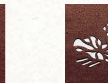
㉙ ハス-D (WSB-47) 1-1177-2901 ¥800 絵柄サイズ約83×45