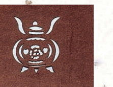
㉓ 釜-B (WSB-43) 1-1177-2301 ¥800 絵柄サイズ約40×51