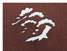
④ 松-D (WSB-22) 1-1177-0401 ¥800 絵柄サイズ約64×51