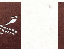
㉚ ハス-E (WSB-49) 1-1177-3001 ¥800 絵柄サイズ約64×49