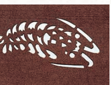
㉕ エビー-B (WSB-41) 1-1177-2501 ¥800 絵柄サイズ約93×44