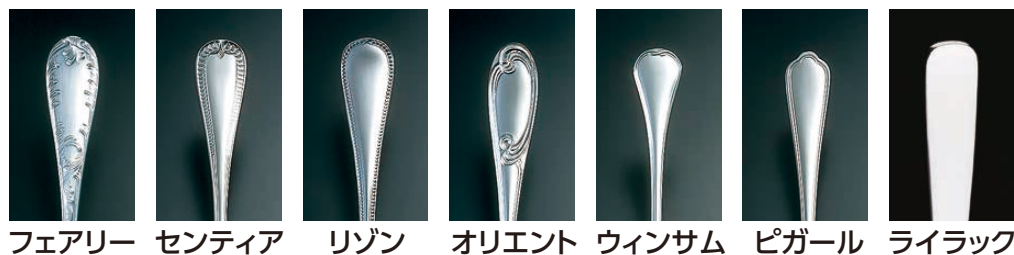
フェアリー センティア リゾン オリエン트 ウィンサム ピガール ライラック

③ Ω 洋白フェアリー ケーキサーバー 〈OHE-01〉 1-1140-0301 ¥8,800 全長:261 幅:59