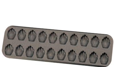
1 ゴーベル マドリネット 20ヶ取 264510 〈WGC-42〉 1-1127-0101 ¥5,500 395×125×H12 (1ヶ当たり 内31×42×H10) 材質:スチール・フッ素樹脂加工 🇫🇷

料理道具 調理小物 調理機械 厨房機器・設備 サビ防止用品 喫茶用品 軽食・鉄板焼用品 製菓用品 フロン 洗濯用 清掃用品 長靴白衣・衛生 消耗品 バンケットウェア フラットウェア テーブルウェア 卓上備品 料理演出用品 グラス・食器 ホテル・旅館用品 テーブル・椅子 サイン 店舗備品