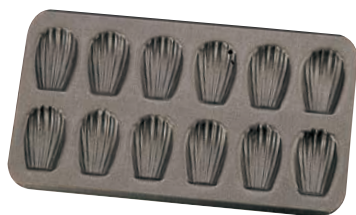
2 ゴーベル マドリネット 12ヶ取 264710 〈WGC-41〉 1-1127-0201 ¥6,900 395×227×H17 (1ヶ当たり 内47×77×H16) 材質:スチール・フッ素樹脂加工 🇫🇷