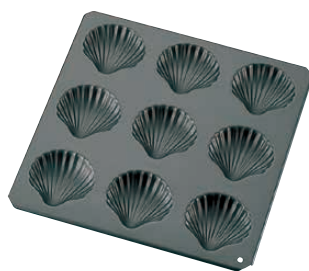
6 9ヶ取 No.5046 〈WMD-29〉 1-1127-0601 ¥2,000 248×254×H17 (1ヶ当たり 内63×63×H16)