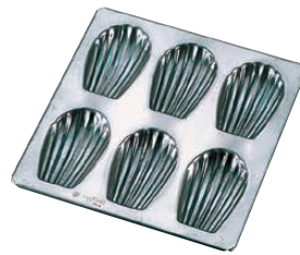
11 シリコン加工 マドレーヌ 貝型6ヶ取 No.147 〈WMD-33〉 1-1127-1101 ¥1,650 189×198×H15 (1ヶ当たり 内47×75×H14) 材質:ブリキ・シリコン加工