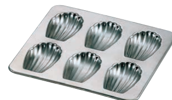
8 18-8 マドレーヌ シェル型 PP-643 〈WMD-41〉 1-1127-0801 ¥2,150 200×200×H17 (1ヶ当たり 内46×80×H16)