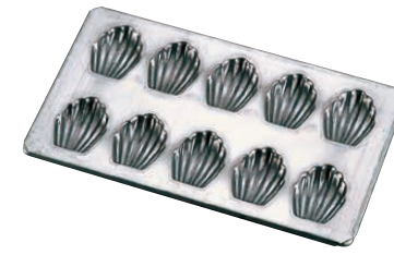
12 シリコン加工 マドレーヌ 貝型 10ヶ取 No.148 〈WMD-32〉 1-1127-1201 ¥1,500 210×125×H11 (1ヶ当たり 内30×40×H10) 材質:ブリキ・シリコン加工