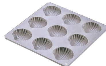
4 アルブリット マドレーヌシェル型 9P No.5248 〈WMD-43〉 1-1127-0401 ¥2,300 255×248×H14 (1ヶ当たり 内63×63×H16) 材質:アルミニウム・フッ素樹脂2コート