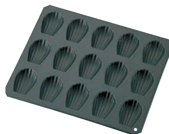
7 15ヶ取 No.5084 〈WMD-31〉 1-1127-0701 ¥2,200 269×228×H13 (1ヶ当たり 内40×57×H12) ⑤~⑦ 材質:スチール・フッ素樹脂加工