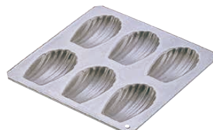
3 アルブリット マドレーヌシェル型 6P No.5247 〈WMD-42〉 1-1127-0301 ¥1,800 200×190×H17 (1ヶ当たり 内46×77×H16) 材質:アルミニウム・フッ素樹脂2コート