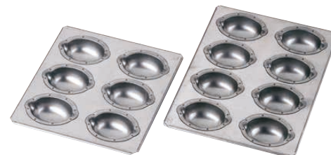
15 シリコン加工 レモン型天板 〈WTV-B6〉 1-1127-1501 6ヶ取 218×238×H30 ¥ 8,600 (1カップ 内78×54×H28) 1-1127-1502 8ヶ取 218×300×H35 ¥10,000 (1カップ 内78×54×H28) 材質:ブリキ・シリコン加工