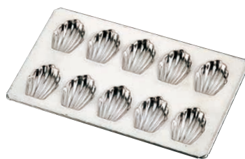
14 ブリキ マドレーヌ 貝型 10ヶ取 No.119 〈WMD-35〉 1-1127-1401 ¥1,150 210×125×H11 (1ヶ当たり 内30×40×H10)