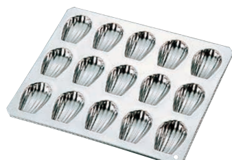
9 ギルア マドレーヌ シェル型 15ヶ取 No.909 〈WMD-38〉 1-1127-0901 ¥1,400 270×228×H13 (1ヶ当たり 内40×56×H12) 材質:スチール・クロームメッキ