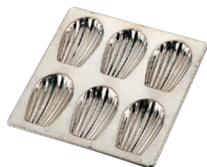
13 ブリキ マドレーヌ 貝型 6ヶ取 No.104 〈WMD-36〉 1-1127-1301 ¥1,200 189×198×H15 (1ヶ当たり 内47×75×H14)