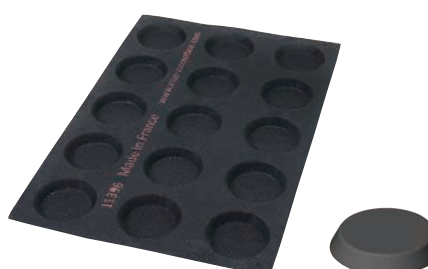
⑩ ブリオッシュ 15取 011396-4060