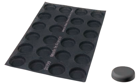
④ ハンバーガー 24取 010799-4060