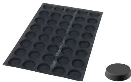
② ハンバーガー 40取 010283-4060