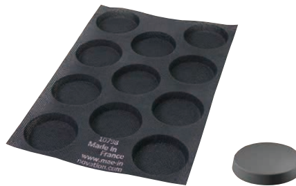
⑥ ハンバーガー 11取 010798-4060