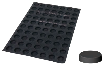
① ミニハンバーガー 70取 012568-4060

約30年の実績と経験を持つフランスのシリコンモールドメーカー“Mae Innovation”社。 シリコン型、グラスファイバー型を幅広く製造しており革新的なソリューションを提供しています。