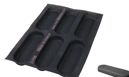
⑯ チャバタ 6取 010796-4060