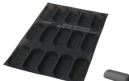
⑮ バゲット 15取 010883-4060