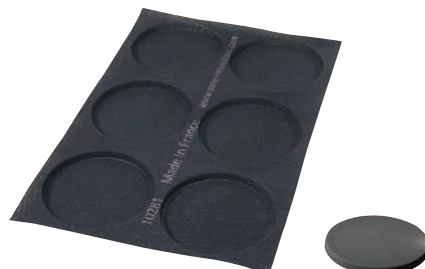
⑨ ハンバーガー 6取 010281-4060