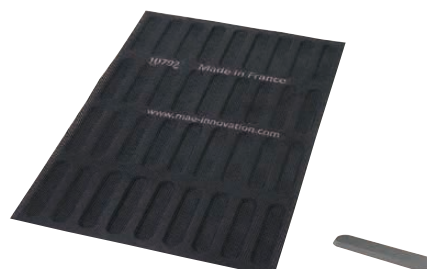
⑪ エクレア 36取 010792-4060