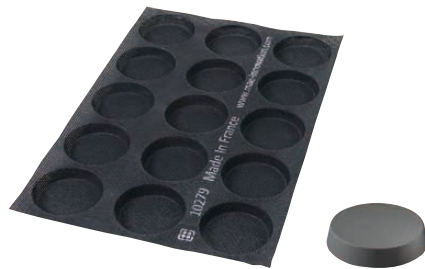
⑤ ハンバーガー 15取 010279-4060