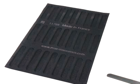
⑫ エクレア 27取 011788-4060