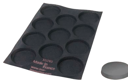
⑦ ハンバーガー 11取 010289-4060