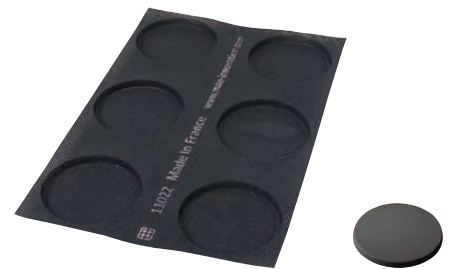
⑧ ハンバーガー 6取 011022-4060