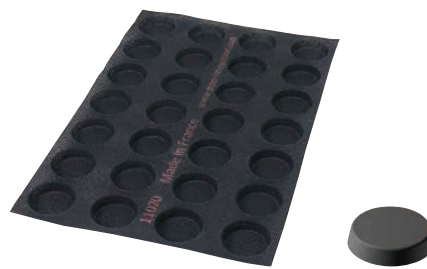
③ ハンバーガー 28取 011070-4060