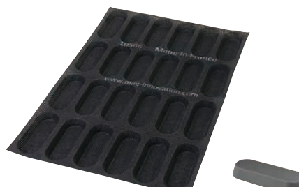
⑭ パン・オ・レ 24取 010566-4060