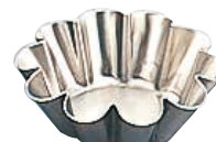
㉒ 18-8 ブリオッシュ型 〈WBL-40〉