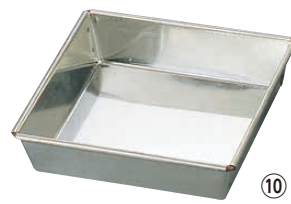
⑩ マトファ 角マンケ 〈WMV-13〉