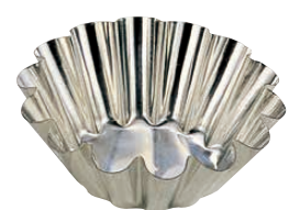
⑯ マトファ ブリオッシュ・14ウェーブ 〈WBL-05〉