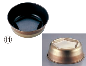
⑪ マトファ スターマンケ 71460