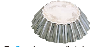
㉑ マトファ ブリオッシュ・細かいウェーブ 〈WBL-08〉