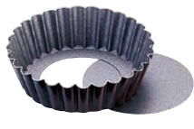
⑨ ゴベル ギザ丸マンケ 底取 224810