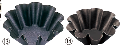
⑬ ゴベル ブリオッシュ・10ウェーブ 〈WGC-19〉