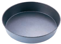
① マトファ エグゾパン フラット丸マンケ 〈WMV-16〉

料理道具 調理小物 調理機械 厨房機器・設備 サービス用品 喫茶用品 軽食・鉄板焼用品 製菓用品 ワゴン 洗浄用 清掃用品 長靴白衣・衛生 消耗品 パンケットウェア フラットウェア テーブルウェア 卓上備品 料理演出用品 グラス・食器 ホテル・旅館用品 テーブル椅子 サイン 店舗備品