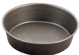
⑦ ゴベル フラット丸マンケ 〈WGC-12〉