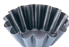
⑮ マトファ エグゾパン ブリオッシュ・14ウェーブ 〈WBL-11〉