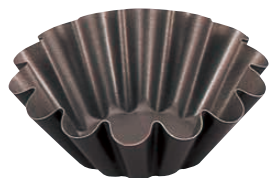
⑫ ゴベル ブリオッシュ・14ウェーブ 〈WGC-14〉