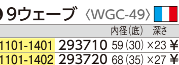
⑭ ゴベル ブリオッシュ・9ウェーブ 〈WGC-49〉