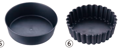
⑤ マトファ エグゾグラス 丸マンケ 345201