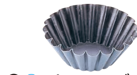
⑳ マトファ エグゾパン ブリオッシュ・細かいウェーブ 〈WBL-12〉