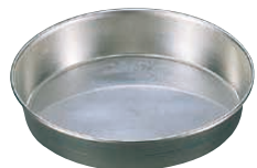
② マトファ フラット丸マンケ 〈WMV-12〉