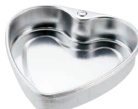
⑪ TPハートケーキ型 (WKC-B7)