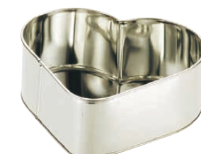
⑬ ブリキデコレーションハート型 小々 (WDK-09)

1-1088-1301 ¥2,140 内(A)133×(B)102×(C)120×H60