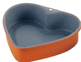
⑩ トッピングオレンジハートケーキ型 (WKC-10)