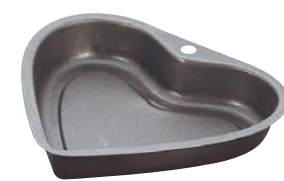
⑨ ブラック・フィギュアハートケーキ型 (WKC-11)

1-1088-0801 ¥4,900 内(A)225×(B)190×(C)220×H40 材質:スチール・フッ素樹脂加工