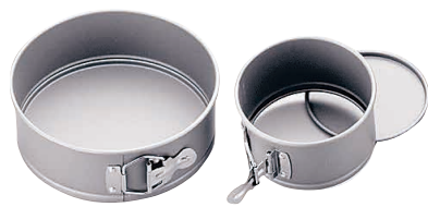
⑤ バネ式デコ型 (WDK-73)