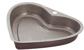
⑧ ゴベルハートケーキ型 225010 (WGC-16)

1-1088-0701 ¥4,500 内(A)165×(B)145×(C)165×H37 材質:ステンレス・内面フッ素樹脂2コート ※外側はフッ素樹脂を加工する時に高熱で変化した色で、材質上も使用上も何のさしつかえもございません。