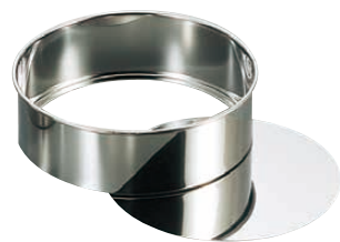
② 18-0デコ底取型 (WDK-03)