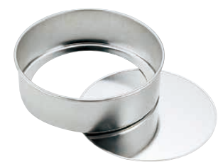
④ アルスター安全デコ底取型 (WDK-30)