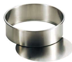
③ 18-8ケーキ丸底取型 (WKC-J0)