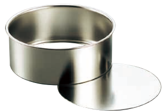
① 18-8総絞りレアケーキ底取型 (WLA-01)