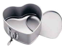
⑥ バネ式ハート型 No.3510 (WDK-74)

1-1088-0601 ¥2,200 内159×160×H72 材質:本体/スチール(フッ素樹脂コーティング) 止め具/ステンレス