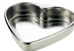
⑫ 18-8デコレーションケーキハート型 (WDK-10)