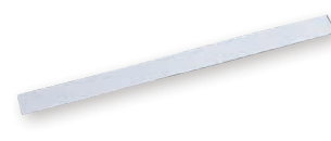
⑮ 純白デコレシートサイド (1,000枚入) (WDK-76)