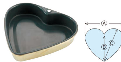
⑦ Ωストロングコートハートケーキ型 中 (WKC-B6)

1-1088-0601 ¥2,200 内159×160×H72 材質:本体/スチール(フッ素樹脂コーティング) 止め具/ステンレス