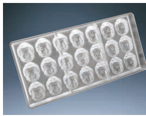
⑤ 大仏 21PCS 901661 〈WTY-E8〉☑️ 1-1071-0501 ¥8,300 出来上がり寸法:27×35×H19 出来上がり容量:約10g