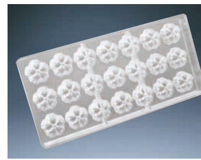
⑦ サクラ 21PCS 901918 〈WTY-F0〉☑️ 1-1071-0701 ¥8,300 出来上がり寸法:31×30×H15 出来上がり容量:約9g