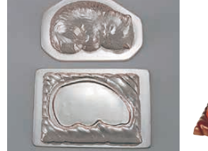
⑪ チョコレートモルド ネコ EU-698 〈WTY-76〉 1-1071-1101 ¥25,000 170×130×H70