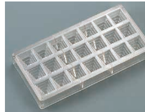
⑯ チョコレートモルド ピラミッド 21PCS DRC-1260 〈WTY-84〉1-1071-1601 ¥8,600 275×135×H24 できあがり容量:約8g