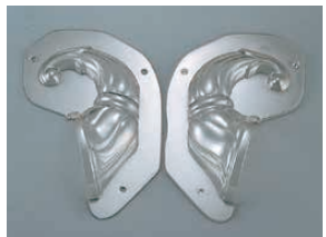
⑧ チョコレートモルド ホーン型 EU-735 (両面合わせ) 〈WTY-77〉1-1071-0801 ¥44,000 φ130×250×H150