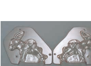
⑩ チョコレートモルド ロバ EU-738 (両面合わせ) 〈WTY-75〉1-1071-1001 ¥28,000 全高:180