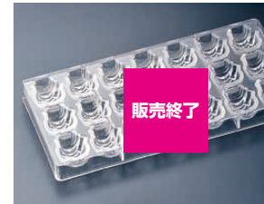
⑰ チョコレートモルド スノーマン 21PCS DRC-1333 〈WTY-85〉1-1071-1701 ¥8,600 廃盤 275×135×H24 できあがり容量:約12g