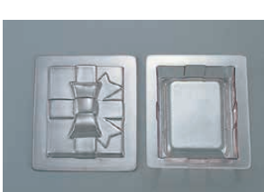
⑨ チョコレートモルド ボックス型 EU-648 〈WTY-78〉1-1071-0901 ¥28,000 155×120×H60