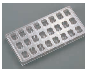
⑫ チョコレートモルド ハートA 24PCS C-1023 〈WTY-79〉1-1071-1201 ¥8,600 275×135×H24 できあがり容量:約10g