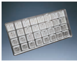
① キューブ 32PCS 901676 〈WTY-E4〉☑️ 1-1071-0101 ¥8,300 出来上がり寸法:約22×22×H19 出来上がり容量:約11g

●本体寸法:275×135 ●耐熱温度:0~+100℃ ●材質:ポリカーボネイト