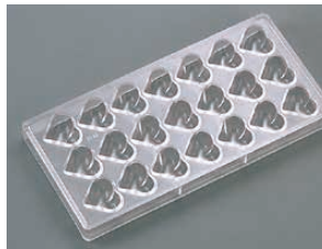
⑮ チョコレートモルド ハートB 21PCS DRC-1218 〈WTY-83〉1-1071-1501 ¥7,300 275×135×H24 できあがり容量:約7g