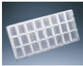
② ブッシュドノエル 24PCS 901393 〈WTY-E5〉☑️ 1-1071-0201 ¥8,300 出来上がり寸法:36×26×H18 出来上がり容量:約18g