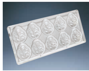
④ 像 10PCS 901608 〈WTY-E7〉☑️ 1-1071-0401 ¥8,300 出来上がり寸法:55×45×H7 出来上がり容量:約11g