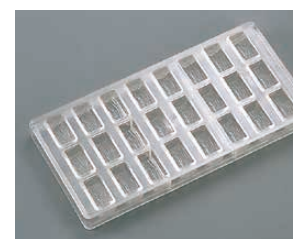
⑭ チョコレートモルド ノエル 24PCS DRC-1080 〈WTY-82〉1-1071-1401 ¥8,600 275×135×H24 できあがり容量:約5g