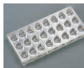
⑬ チョコレートモルド クラウン 24PCS DRC-1028 〈WTY-80〉1-1071-1301 ¥8,600 275×135×H24 できあがり容量:約9g