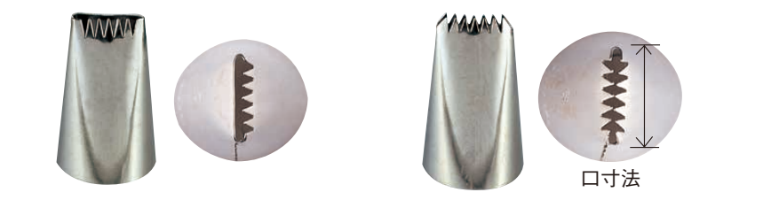
③ Ω 18-8 口金片目 (WKT-35) ④ Ω 18-8 口金両目 (WKT-36)