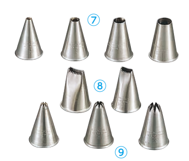
⑦ 18-8 口金(丸) φ25×H36 (WKT-K3) 目 ¥900