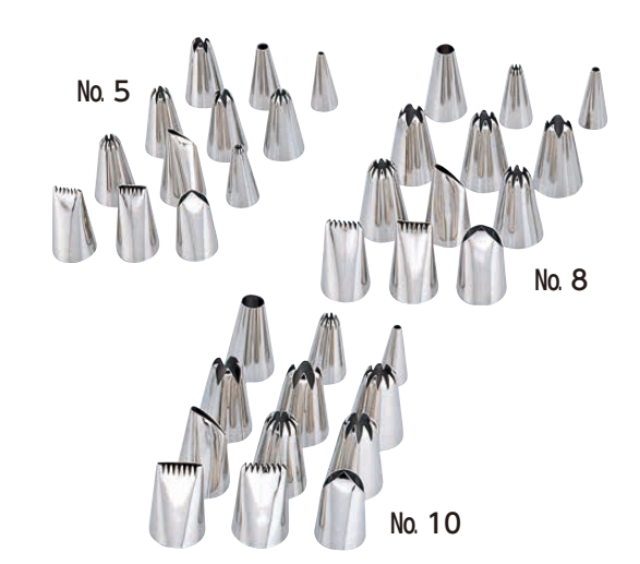
⑩ Ω 18-8 口金セット (WKT-38)