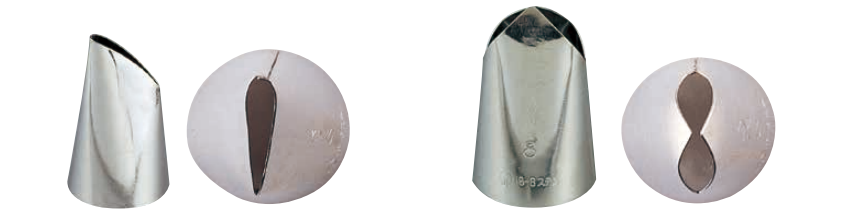
⑤ Ω 18-8 口金バラ (WKT-33) ⑥ Ω 18-8 口金ハッパ (WKT-34)