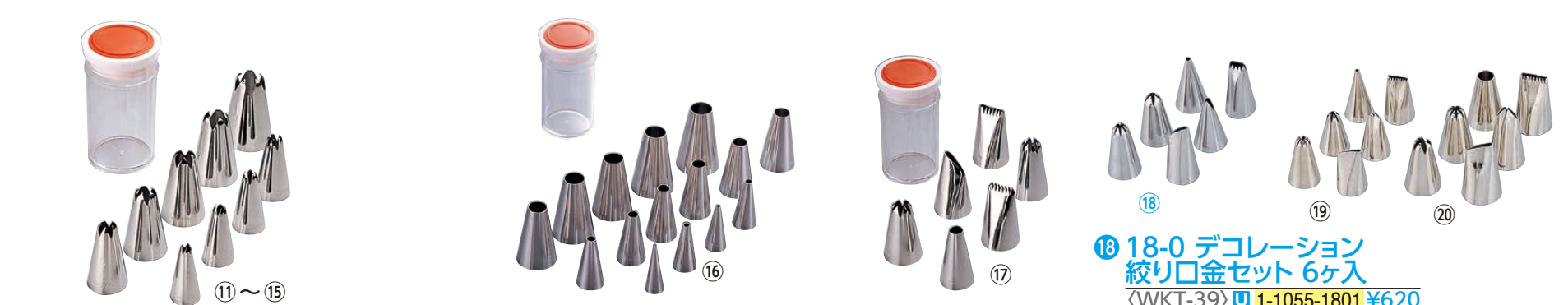
Ω ケース入 18-8 口金セット