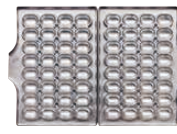
ベビーカステラ32個取 焼き上がりサイズ 40×30×厚さ30