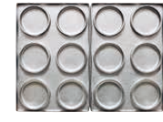
大判焼き6個取 焼き上がりサイズ φ78×厚さ28