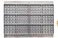
ベルジャンワッフル長角型6個取 焼き上がりサイズ 98×79×厚さ26