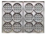
ベルジャンワッフル丸型6個取 焼き上がりサイズ φ87×厚さ26