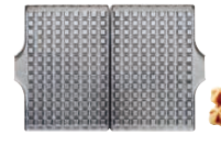
クロワッサンワッフル 焼き上がりサイズ 199×298×厚さ26