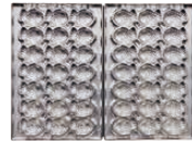
ミニ鯛焼き21個取 焼き上がりサイズ 50×35×厚さ26