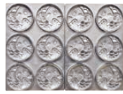
たい丸君6個取 焼き上がりサイズ φ90×厚さ28