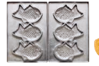
鯛焼き3個取 焼き上がりサイズ 140×85×厚さ30