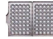
ベビーカステラ丸型40個取 焼き上がりサイズ 30×30×厚さ30