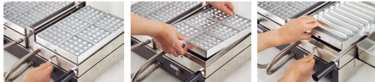
●ワンタッチでプレートの取り外しができ、清掃がとても簡単です。